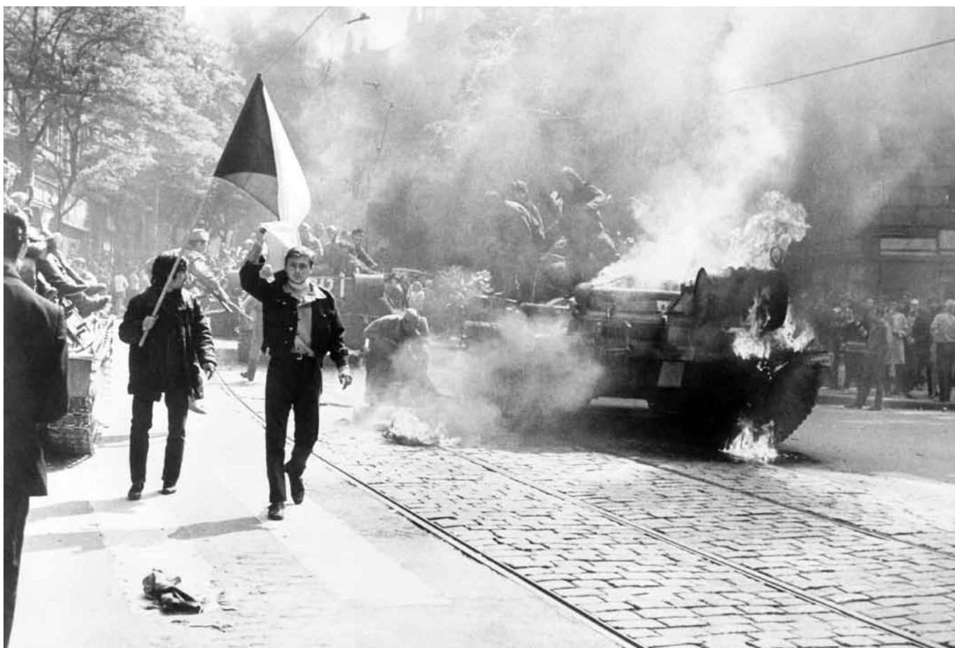
Leit aus der tschechoslowakescher Hauptstadt Prag demonstréiere virun engem sowjetesche Panzer.

werde sich langsam aber sicher in den sozialistischen Ländern durchsetzen und ein reformierter demokratischer Sozialismus sei realisierbar. Das war in der KP aber nicht diskussionsfähig. Es gab also die Wahl, darüber in der KP offen zu diskutieren und als Folge auszutreten, bzw. hinauszufiegen, oder auf ein Umdenken zu hoffen. Die Frage, was richtig gewesen wäre, beschäftigt mich immer noch." [3] Wéi den Änder Hoffmann hunn der eng ganz Reih d'Fauscht an der