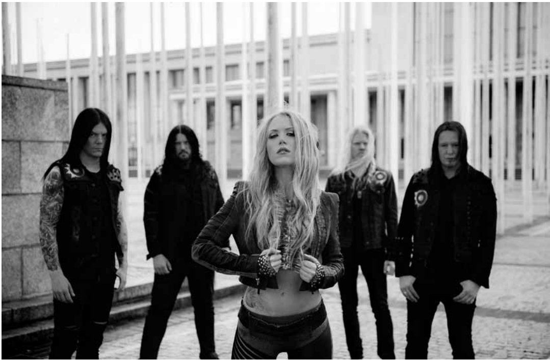
Une femme forte et ses musiciens : Arch Enemy, un ovni dans la scène metal très masculine.