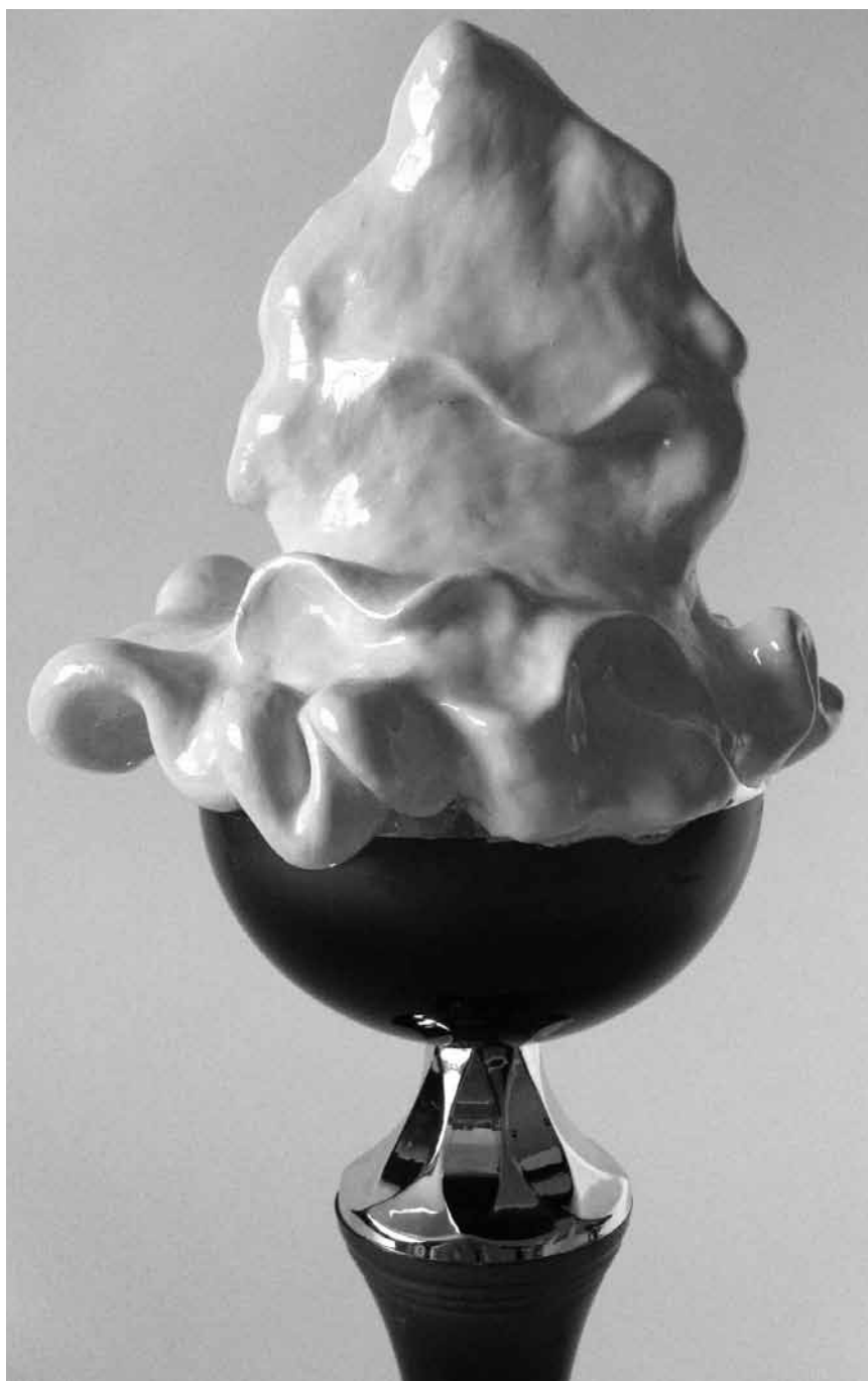
Le CAW Walferdange vous offre une belle glace pendant l'été : « Spectrum », sculptures de Tessy Bauer et peintures de Gast Michels - jusqu'au 29 juillet.