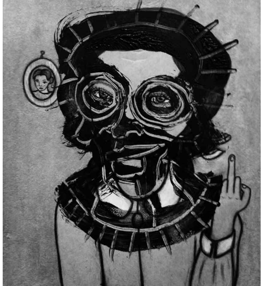
Un doigt d'honneur aux critiques ? Les dessins de Julien Hübsch sous le titre « A Deeper Understanding » vous donneront peut-être la clé - jusqu'au 14 juillet au pavillon du Centenaire à Esch.