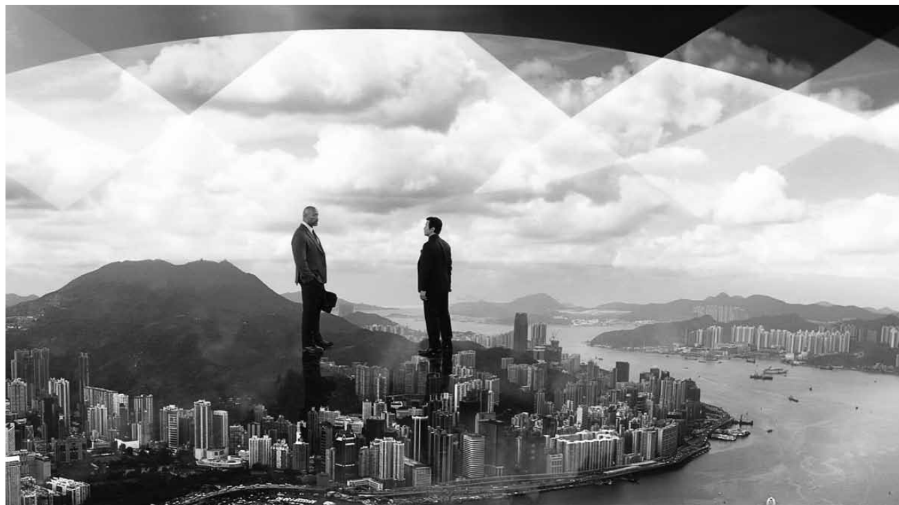
Huch! Ein Hochhaus, Terroristen und viel Rumgeballere ... da fehlt eigentlich nur noch Bruce Willis! In „Skyscraper“ übernimmt aber freundlicherweise Dwayne Johnson die Rolle - neu in fast allen Sälen.

Eigentlich wollten George, Julian, Dick, Anne und Timmy, der Hund ja nur einen gemeinsamen Strandurlaub verbringen. Doch zwei verdächtige Tierfilmer und ein merkwürdiger Tourist, der sich als Regierungsgagent