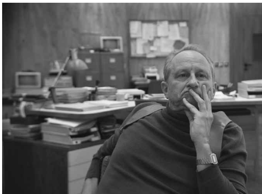
Benoît Poelvoorde en flic, qui l'eût cru ? « Au poste ! », la nouvelle comédie décalée de Quentin Dupieux est à l'Utopia.