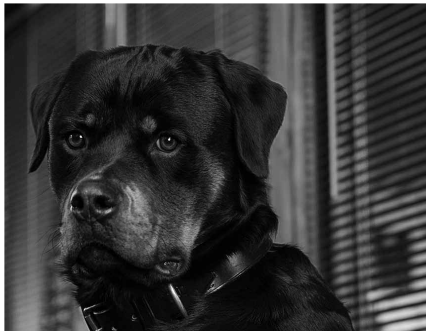
Sprechende Hunde müssen einen gekidnappten Panda finden: „Show Dogs“ - neu im Kinopolis Belval und Kirchberg.