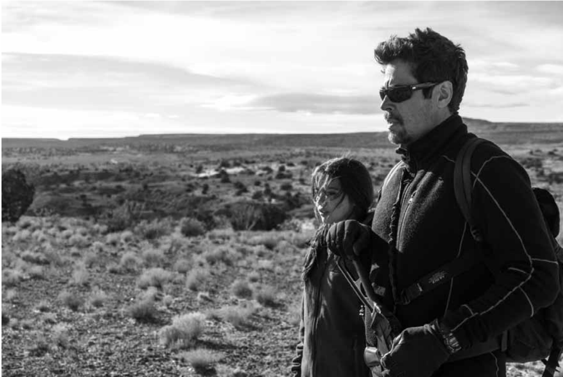
Un peu plus humain que dans la première partie : Benicio Del Toro campe l'avocat devenu vengeur Alejandro Gillick.