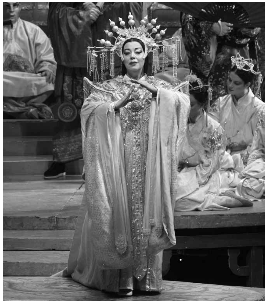
Exotic, spectacular, cruel and ... utterly romantic: that's "Turandot", Puccini's highly ambitious opera, this Saturday, July 21st at the Utopia as part of the MET Summer Encores.