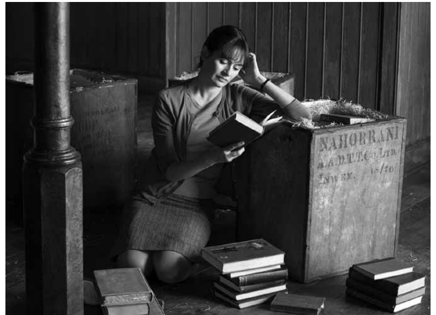
Pas facile d'ouvrir une librairie pour une jeune veuve, dans un village de la côte anglaise des années 1950 : « The Bookshop », nouveau à l'Utopia.

Liliane ist ein aufgewecktes junges Mädchen, das ihren Eltern aber immer wieder Sorgen bereitet. Die Kleine spricht nämlich mit Tieren und das führt dazu, dass die Familie stetig umziehen muss, weil Liliane mit ihren Tieren immer wieder für Ärger und Tumult sorgt.