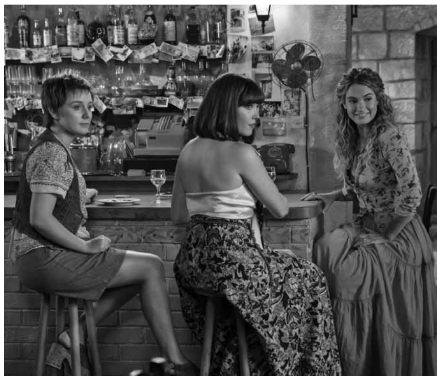
Sonne, Meer und ABBA-Ohrwürmer satt bietet die Fortsetzung des Kassenschlagers „Mamma Mia!“. „Mamma Mia! Here We Go Again“, neu in fast allen Sälen.

Trotz einiger Tragödien in der Vergangenheit führt die Familie Graham, bestehend aus Mutter Annie, ihrem Mann Steve und ihren beiden gemeinsamen Kindern Peter und Charlie, ein recht beschauliches Leben in einem abgelegenen Haus am Waldrand. Doch als Annes Mutter