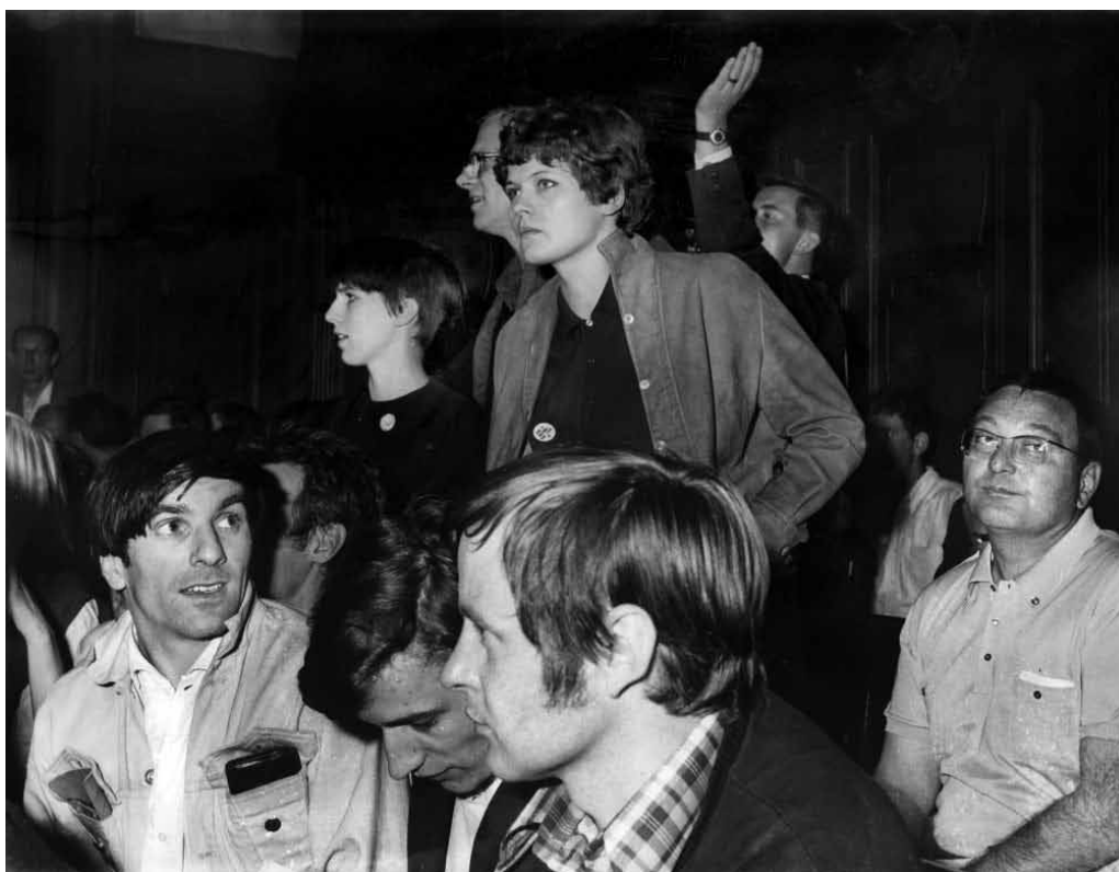
STUDENTENREVOLTE 1968

„Die revolutionäre Ungeduld und ihr Programm“: Rudi Dutschke (links im Bild).