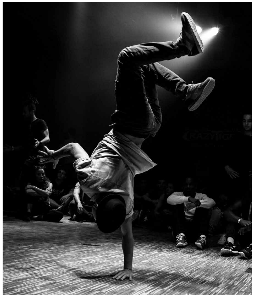
Surfant sur la culture hip-hop, « Break » compte faire revivre les grands moments du film de danse mêlé de sentiments amoureux. Pour savoir s'il y parvient, direction les Kinopolis Belval et Kirchberg.