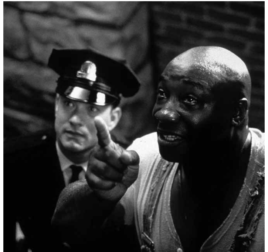
Nach Stephen Kings Roman: „The Green Mile“ ist zwar kein Meilenstein, bleibt aber doch ein Sci-Fi-Klassiker - am 14. August in der Cinémathèque.

À Boston, au 19e siècle, Olive, militante féministe, tente de rallier à sa cause Verena, jeune femme possédant de remarquables dons d'oratrice. Verena fait merveille jusqu'au jour où elle s'éprend d'un jeune avocat fortement opposé à ses idées d'émancipation.