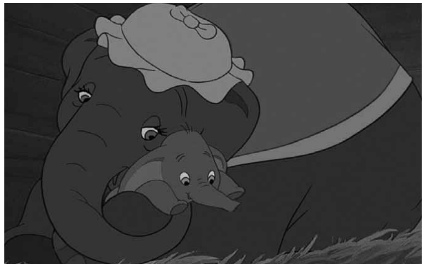
Ehe im Herbst die neue Filmversion auf die Leinwände kommt, wird es Zeit noch mal dem Original zu huldigen: „Dumbo“ am 11. und am 12. August im Kinopolis Belval und Kirchberg.