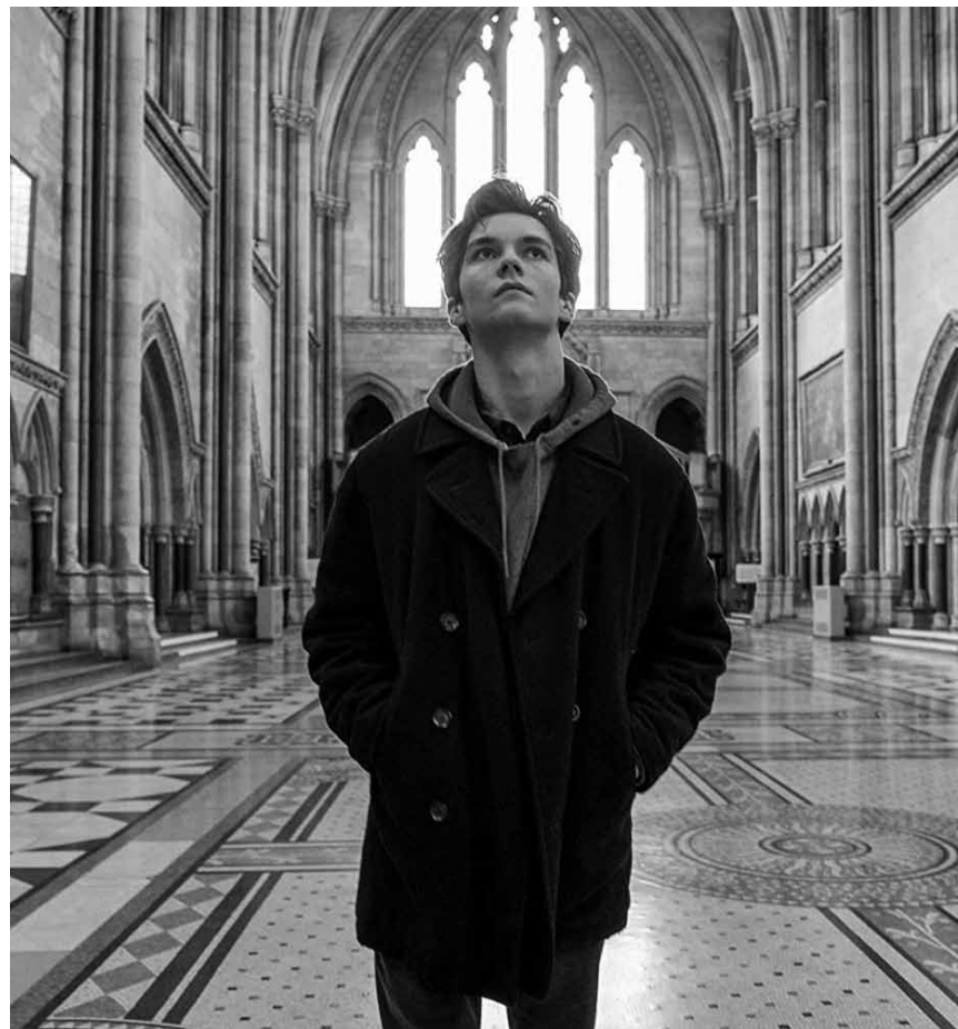
Wenn religiöse Dummheit auf die Justiz trifft: „The Children Act“ - neu im Utopia.

Jedes Jahr dürfen alle Einwohner*innen des Landes für zwölf Stunden tun und lassen, was sie wollen. Es gibt keine Gesetze, bloß Anarchie. Jeder ist für sich selbst verantwortlich und muss sich in Sicherheit bringen, vorausgesetzt er oder sie gehört nicht zu denjenigen, die sich mitten in der Nacht auf die Straße trauen, um ihre bestialischen Triebe auszuleben.