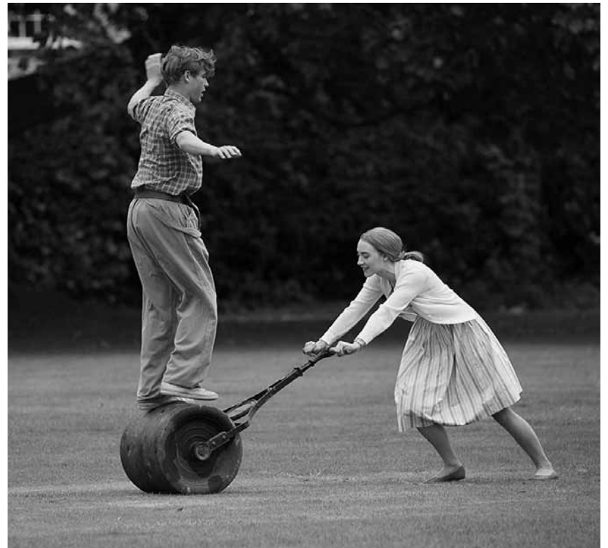
Eine Liebesgeschichte, die sich nicht über soziale Gräben und sexuelle Erwartungen hinwegsetzen kann: „On Chesil Beach“ – nach der Novelle von Ian McEwan, neu im Utopia.

✘ Une version féminine de la série aux vols impossibles ? Bonne idée. Mais Gary Ross n'a pas le flair de Steven Soderbergh : le film tire trop sur la corde de l'opposition entre féminin et masculin et ne retient de la leçon des précédents que ces séquences où préparatifs et action