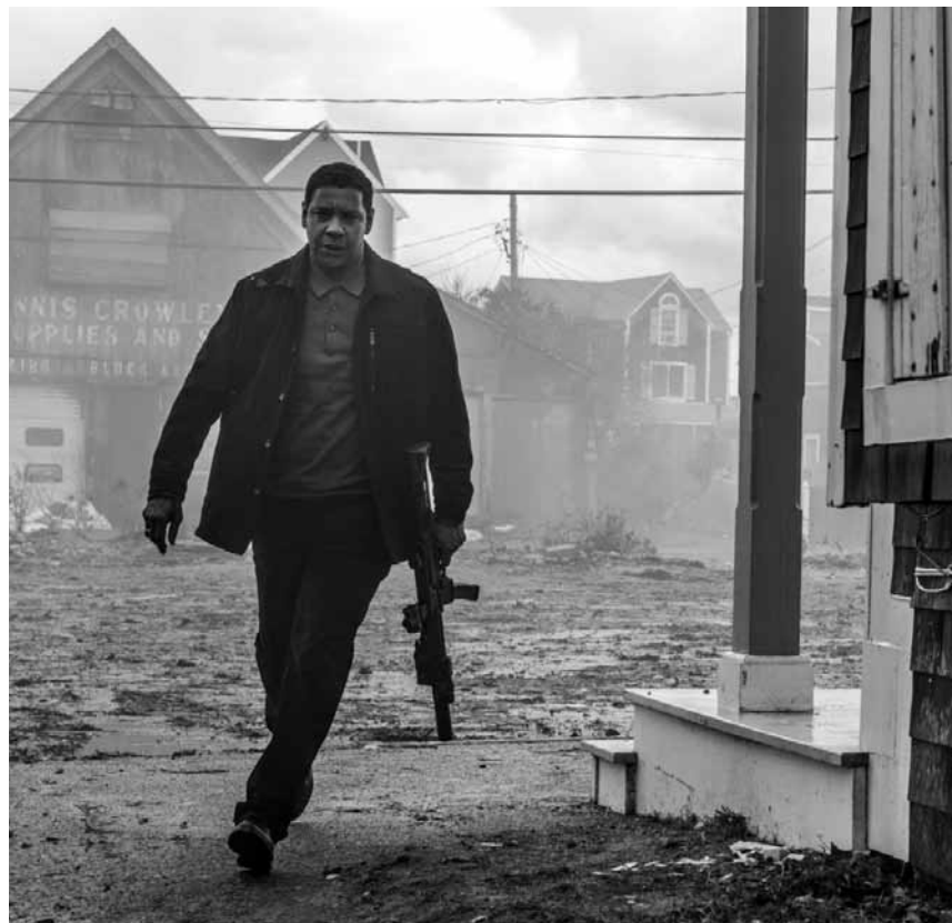
Hat noch lange nicht fertig: Denzel Washington muss in „The Equalizer 2“ noch mal richtig aufräumen - neu im Kinopolis Belval und Kirchberg.

❌❌❌ Ce film d'horreur indé réussit à se démarquer de la masse en ne misant pas - uniquement - sur les moments chocs. Au contraire, il met en avant un scénario brillant, de petites touches çà et là et surtout un crescendo d'enfer. (1c)