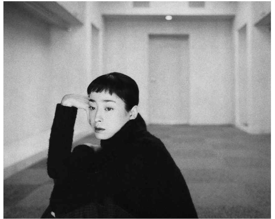
Eine Geschichte von sozialer und materieller Leere: „Tony Takitani“ - am 21. August in der Cinémathèque.