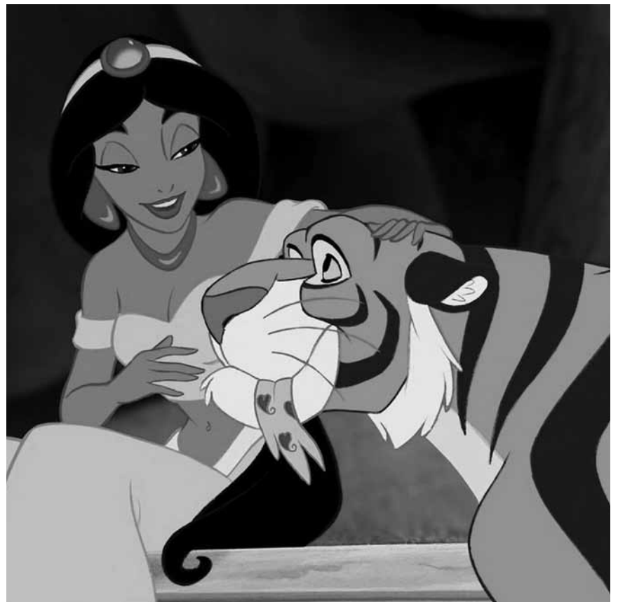
Disneyklassiker im Sommerloch: Am 18. und am 19. August fliegt „Aladdin“ im Kinopolis Kirchberg und Belval ein.