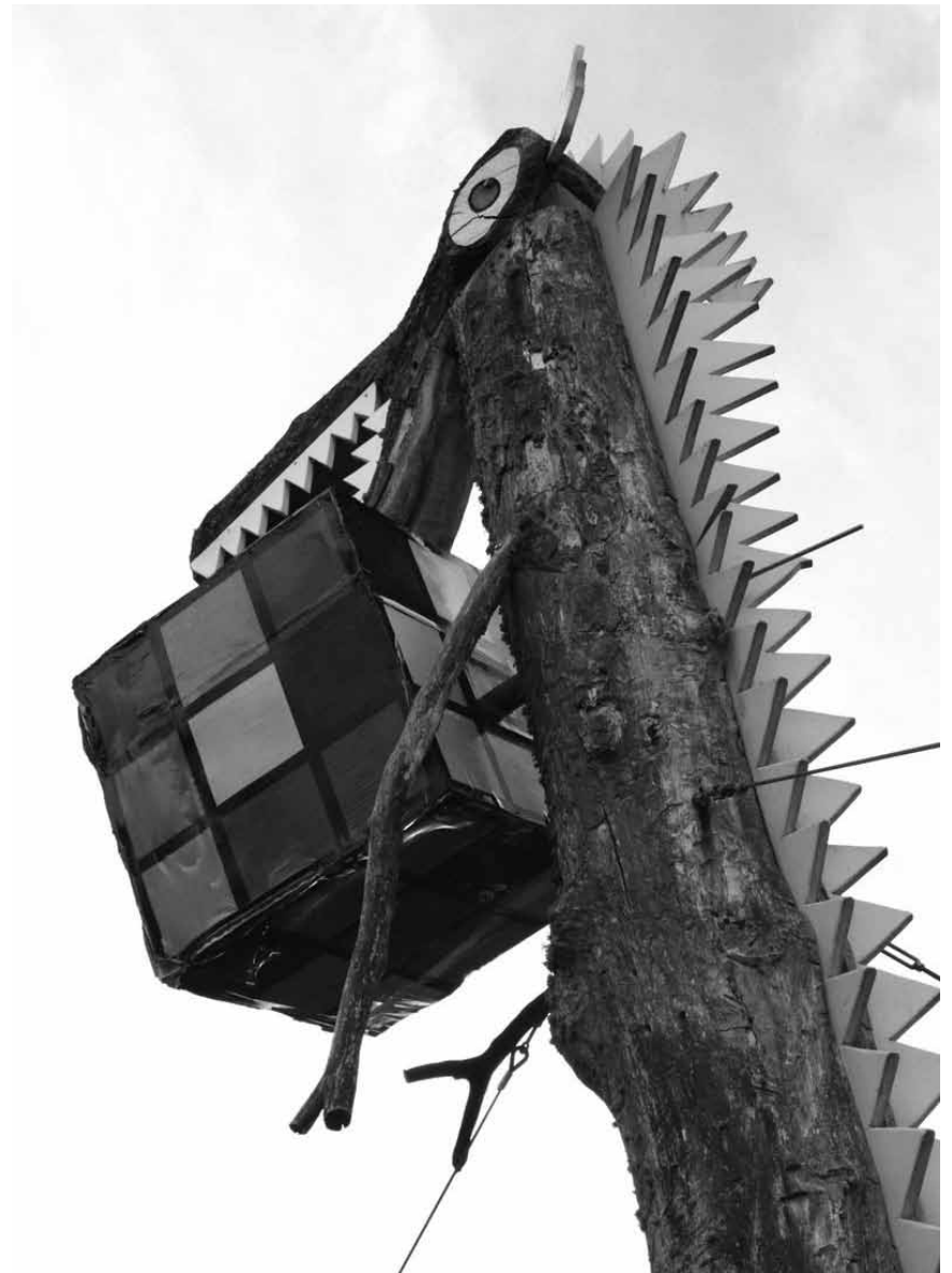
An Festival steet de Weekend an d'Haus: de Kolla Festival zu Stengefort mat Musek, Stänn an aneren Iwwerraschungen.