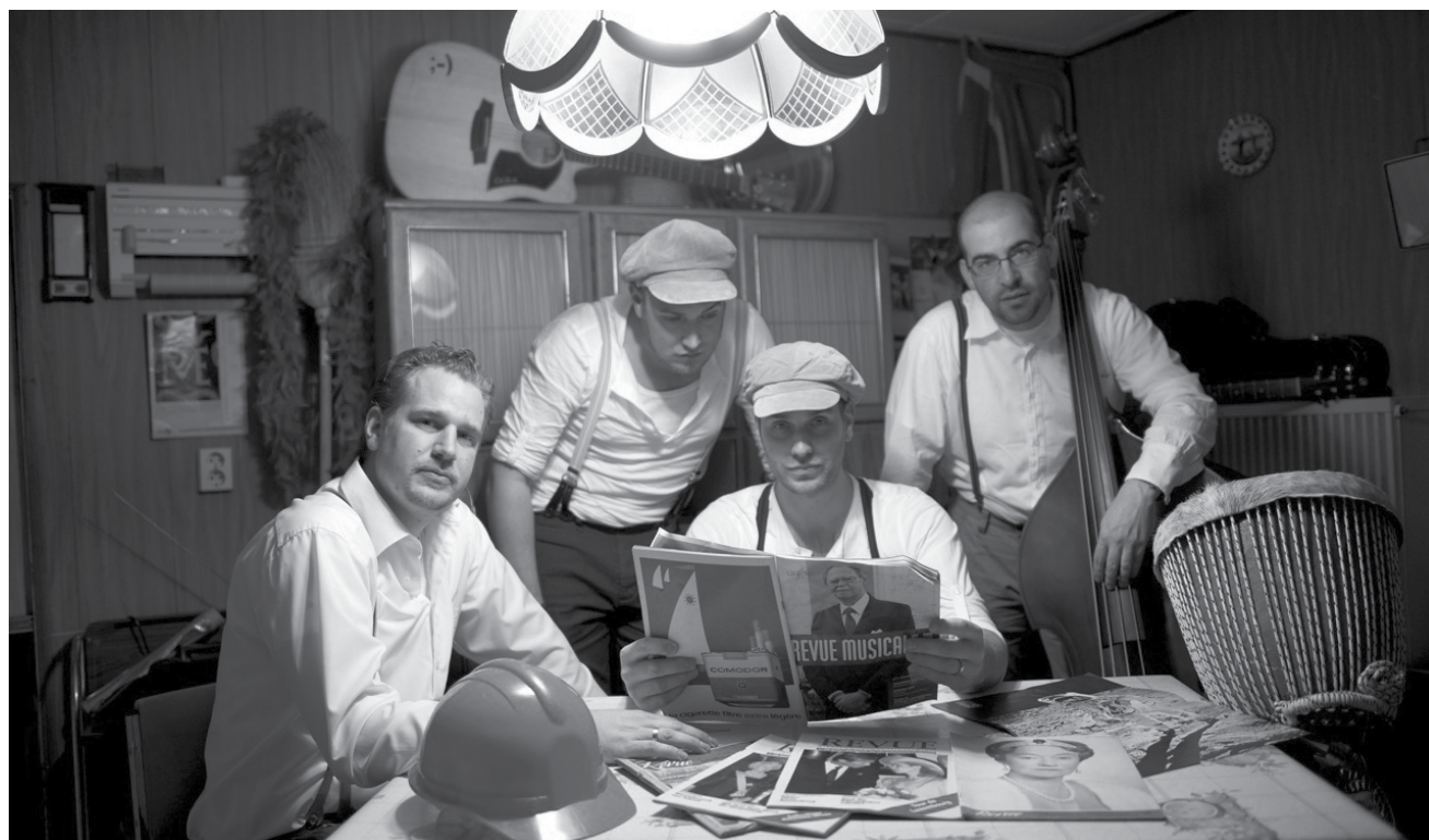
Net ëmmer si Schleeke lues : Och um Rock de Schleek zu Meechtem geet et dëse Weekend héich hier mat ënnert aneren den Dëppegeisser.

Bubble Art , atelier de peinture (> 3 ans), Villa Vauban, Luxembourg, 15h - 17h. Tél. 47 96 49-00. www.villavauban.lu Inscription obligatoire.