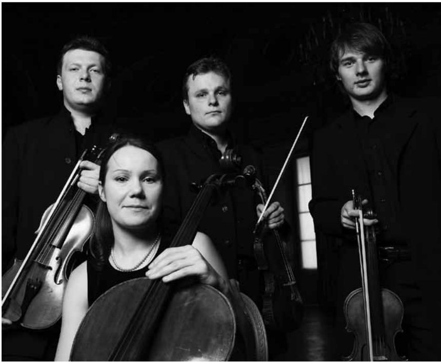
Ob sie wohl auch in der Mitte der Mettlacher Abtei spielen werden? Das Atrium-Quartett tritt dort am 26. August mit Werken von Schostakowitsch, Brahms und Tschaikowsky auf.

L'histoire d'Esch-sur-Alzette de ses origines à nos jours , visite commentée, départ, pl. de l'Hôtel de Ville, Esch , 14h30. Inscriptions au tél. 54 16 37 ou bien sous tourisme@esch.lu