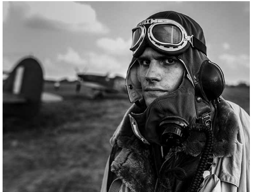
Zwar darf man nun in Polen nicht mehr über Kollaboration reden, Heldenfilme über polnische Piloten, die mit den Engländern den Himmel nazifrei machten, gehen aber immer noch: „Dywizjon 303“ - am 2. September im Kinopolis Kirchberg.