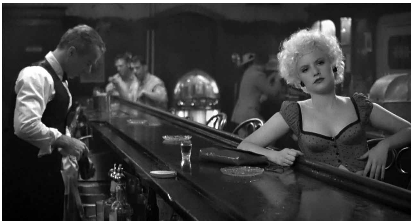
Ein düsteres Brooklyn, das Uli Edel 1989 ausmalte: „Last Exit Brooklyn“ - am 4. September in der Cinémathèque.