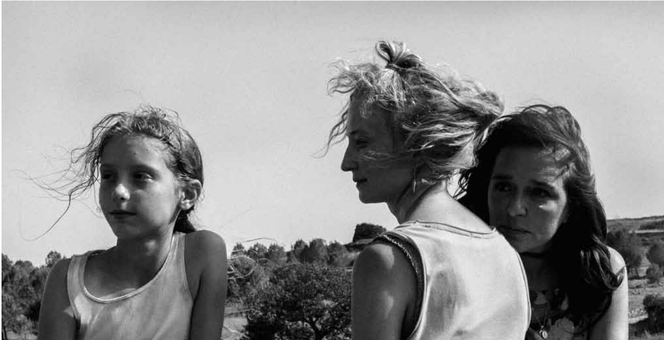
L'innocente, la débauchée et la sainte : la trinité de « Figlia mia » ne dédaigne pas les archétypes.