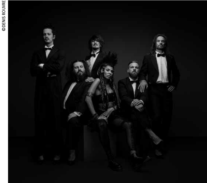
Sans leur singe, mais tout de même au complet : les Shaka Ponk.