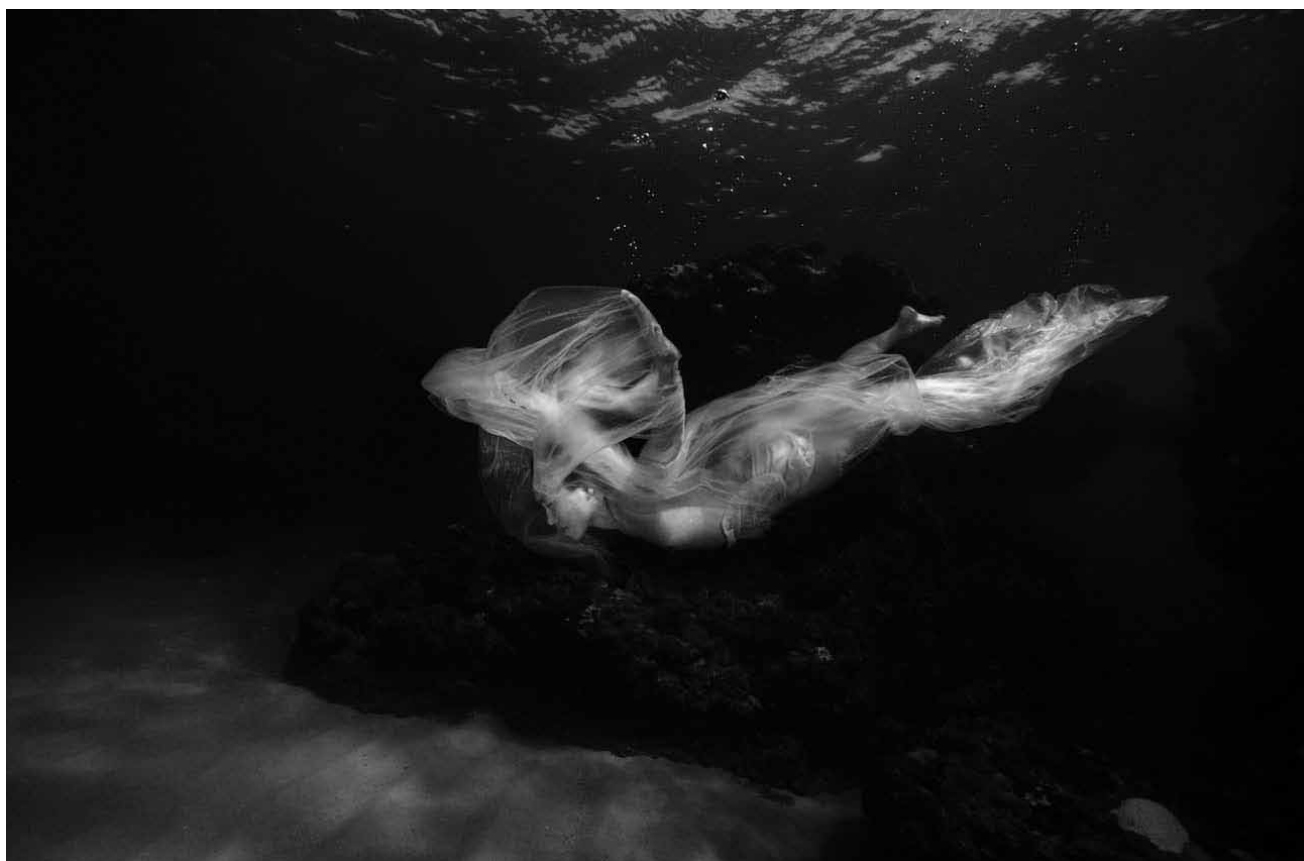
Dans le cadre des « Photomeetings 2018 » la photographe espagnole Isabel Muñoz donnera à voir ses visions subaquatiques dans « Agua » - du 13 septembre au 20 octobre à la galerie Clairefontaine.

pour celles et ceux qui se passionnent pour les arts en général et leur interaction en particulier. » (ft)