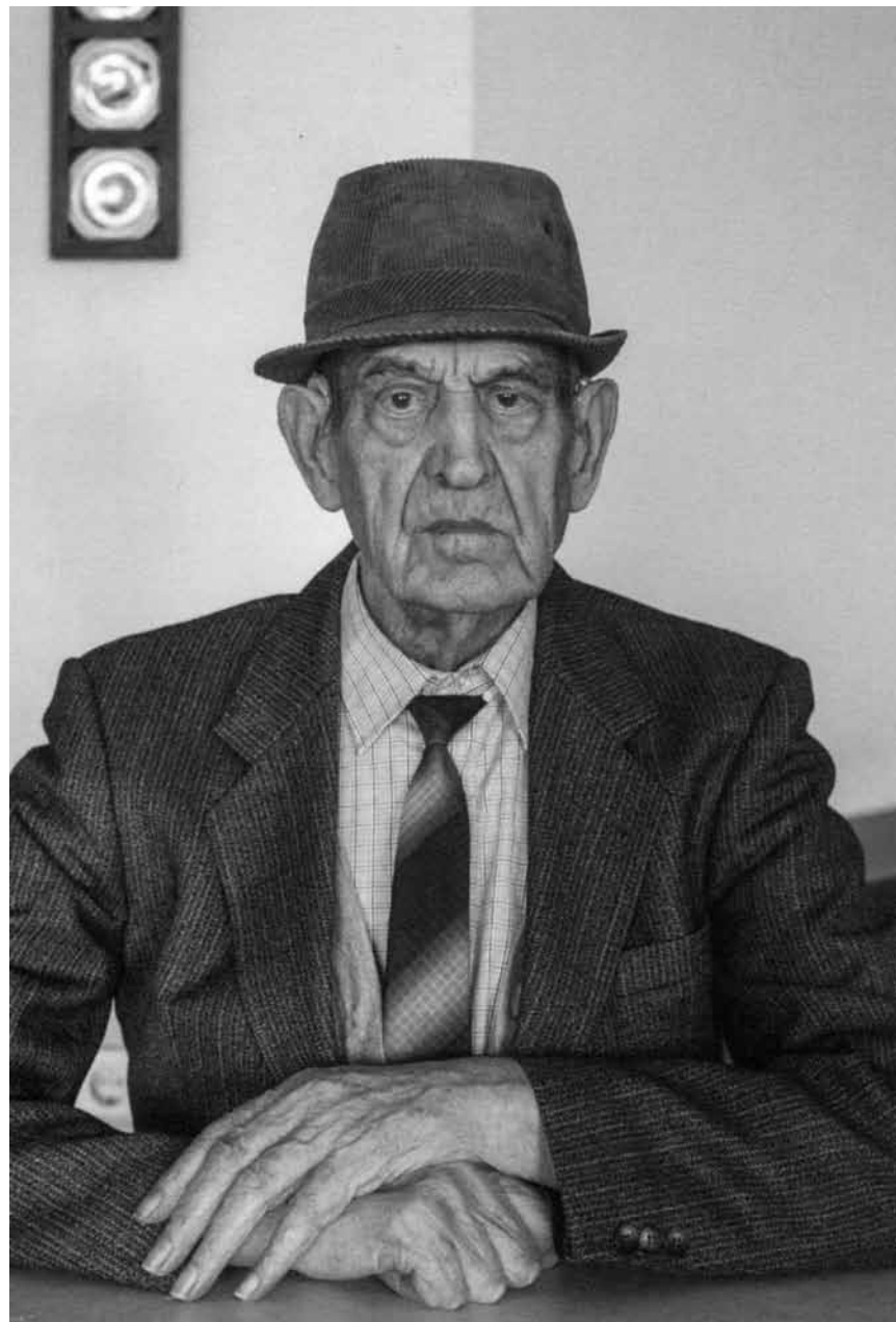
Expériences passées, traumatismes cachés et autres se transmettent entre les générations : « Iris » - l'expo intergénérationnelle de la Croix-Rouge fera escale à Esch-sur-Alzette du 12 septembre au 4 octobre.

(montée du Château. Tél. 92 96 57), Clervaux, me. - di. + jours fériés 12h - 18h.