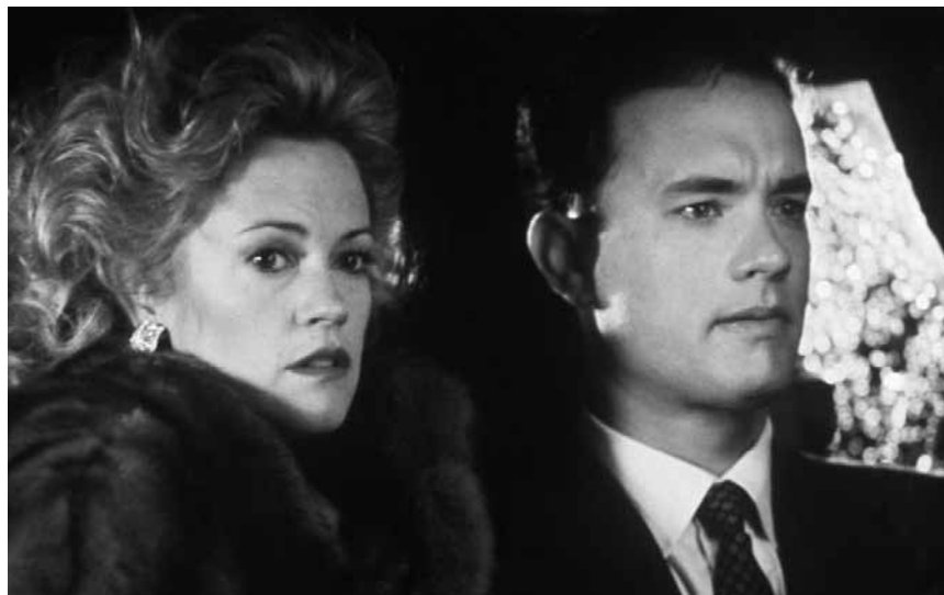
Hanks gegen Willis - und das nicht in einem Action-Film: „The Bonfire of the Vanities“ von Brian De Palma - am 10. September in der Cinémathèque.