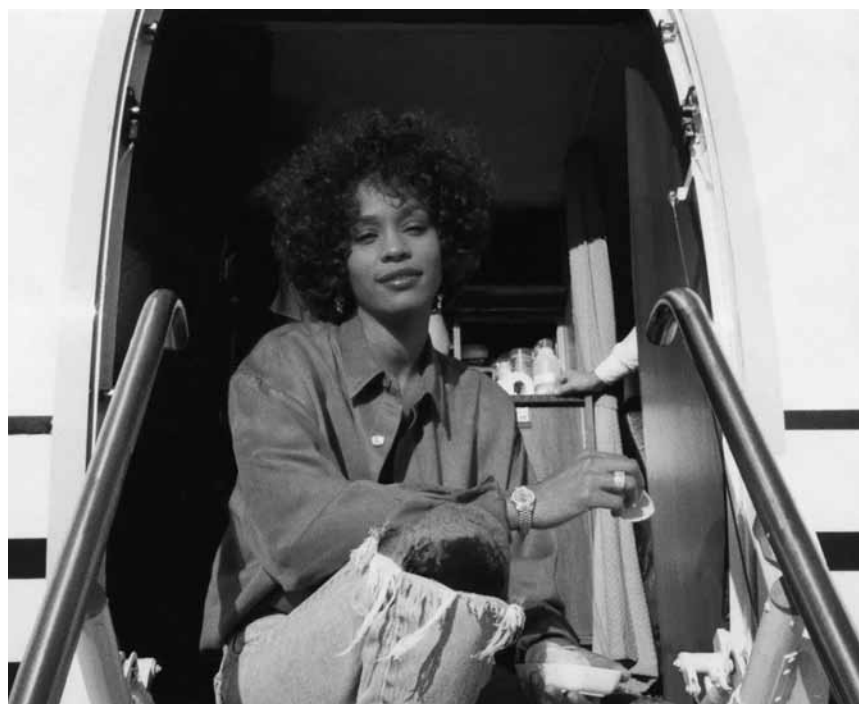
Wenigstens kein Biopic: „Whitney“ ist die erste genehmigte Doku über die verstorbene R'n'B-Sängerin Whitney Houston - neu im Utopia.

Das Oberhaupt der katholischen Kirche beantwortet Fragen zu verschiedenen Themen wie Wirtschaft, Immigration, soziale Ungerechtigkeit, Familie und Glauben, die ihm von Menschen überall auf der Welt gestellt wurden.