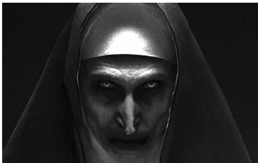
Kindheitstraumata werden Wirklichkeit in „The Nun“ - neu im Kinopolis Belval und Kirchberg.