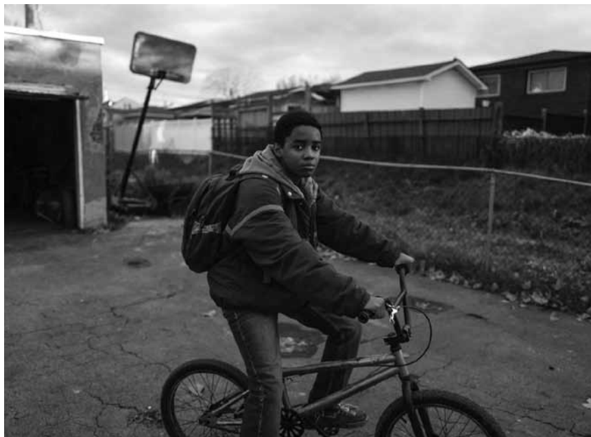
Alien-Waffen, böse Gangster und komplizierte Familienverhältnisse: In „Kin“ geht so Einiges – neu im Kinopolis Belval und Kirchberg.

Un ancien garde du corps qui enchaîne les petits boulots de sécurité dans des boîtes de nuit pour élever sa fille de 8 ans se retrouve contraint de collaborer avec la police. Sa mission : infiltrer l'organisation d'un dangereux chef de gang flamand.