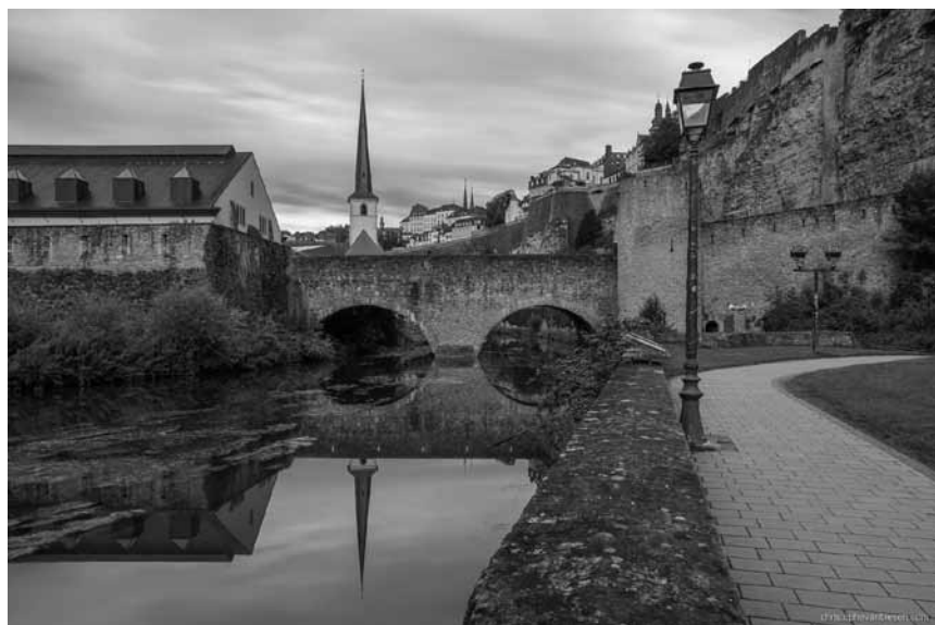
Le photographe luxembourgeois Christophe Van Biesen, spécialisé dans les paysages, expose ses « Landscapes » encore jusqu'à ce dimanche 14 octobre à la maison de la culture d'Arlon.