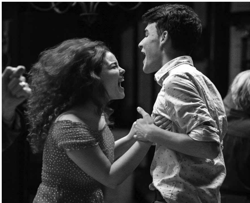
When adoption turns into a nightmare: "Alice T.", by Radu Muntean - at the Cinémathèque on October 17th - part of the CinEast Festival.