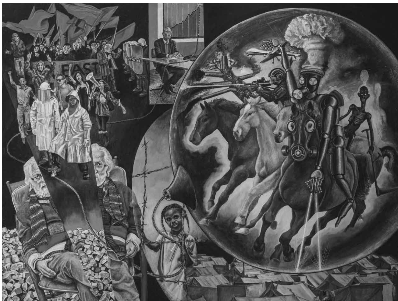
Les tableaux hallucinés et hallucinatoires de Marc Henri Reckinger se montrent à la galerie H2O à Oberkorn entre le 19 octobre et le 4 novembre.

jusqu'au 15.1.2019, lu. - je. + sa. 11h - 01h, ve. 11h - 03h, di. 11h - 19h.