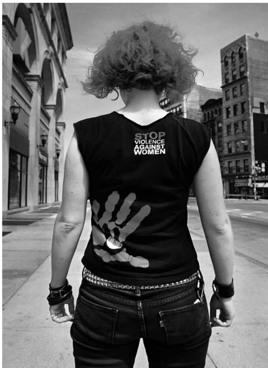
En pleine gueule ou non ? « Not in Your Face », de la photographe américaine Susan Barnett, se concentre sur les messages que les gens portent sur leurs t-shirts - aux Arcades I à Clervaux jusqu'au 27 septembre 2019.

(montée du Château. Tél. 92 96 57), Clervaux, me. - di. + jours fériés 12h - 18h.