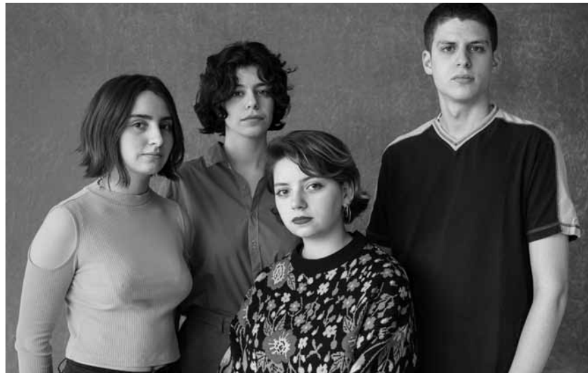
Sie sind vielleicht noch etwas jung, haben es aber voll drauf: Das katalonische Indie-Rock Quartett Mourn stürmt am 25. Oktober die Rotondes.

Kaffi, Kuch an Design , Upcycling- an DIY-Familjeworkshop (> 6 Joer), De Gudde Wëllen, Luxembourg,