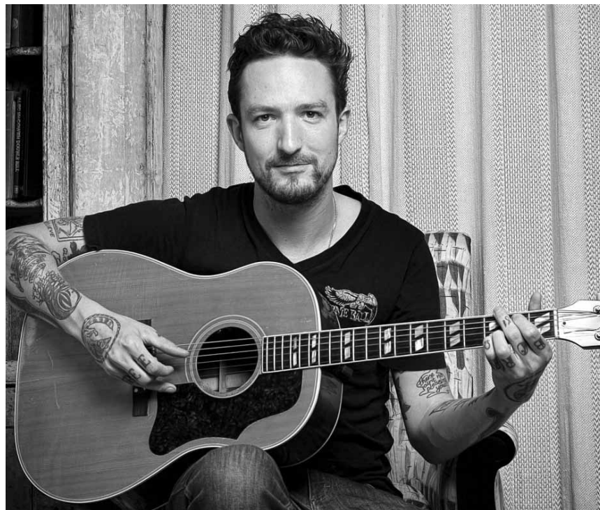
Du post-hardcore au chanteur-interprète à la guitare sèche : l'Anglais Frank Turner jouera à l'Atelier le 21 octobre.