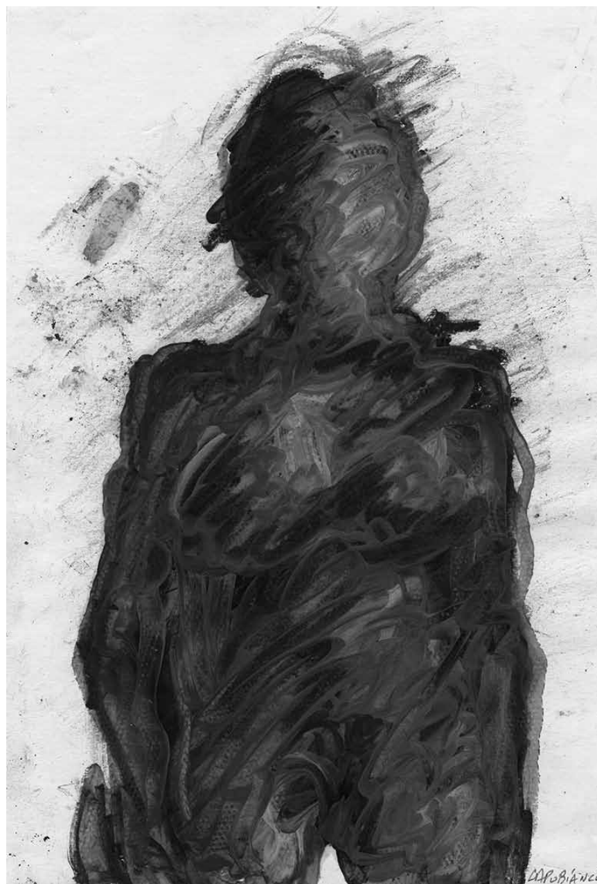
Sortez les loupes ! La « Biennale internationale du petit format papier » est encore jusqu'au 18 novembre à l'espace Beau Site à Arlon.

The Family of Man (montée du Château. Tél. 92 96 57), Clervaux, me. - di. + jours fériés 12h - 18h.