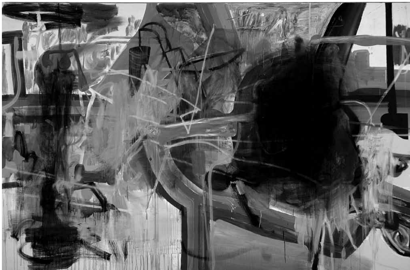
Neuer Wilder des Neoexpressionismus: Albert Oehlen ist Teil der Mudam-Kollektion, die noch bis zum 7. April 2019 zu sehen sein wird.