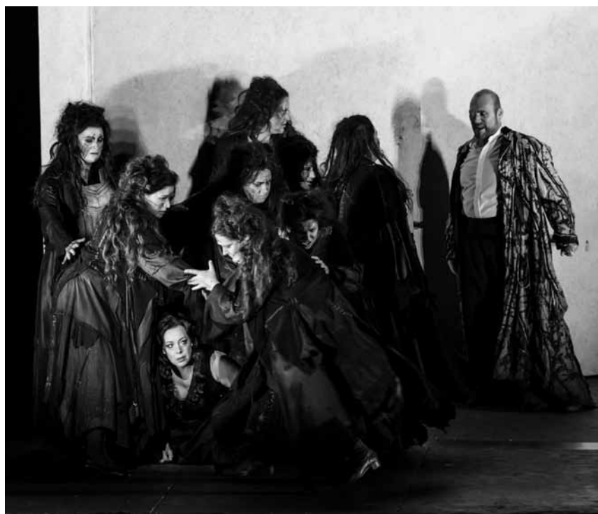
If you love the smell of Wagner in the evening, then a rendezvous with "Die Walküre" is certainly the right thing for you - live from the Royal Opera House in London at the Starlight and the Scala on October 28th.