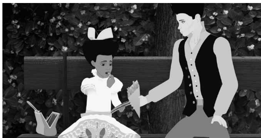
Michel Ocelot - connu pour avoir créé le personnage de Kirikou - reprend du service avec « Dilili à Paris », nouveau à l'Utopia.

C'est dans les couloirs de leur piscine municipale que Bertrand, Marcus, Simon, Laurent, Thierry et les autres s'entraînent sous l'autorité toute relative de Delphine, ancienne gloire des bassins. Ensemble, ils se sentent libres et utiles. Ils vont mettre toute leur énergie dans une discipline jusque-là propriété de la gent féminine : la natation synchronisée.