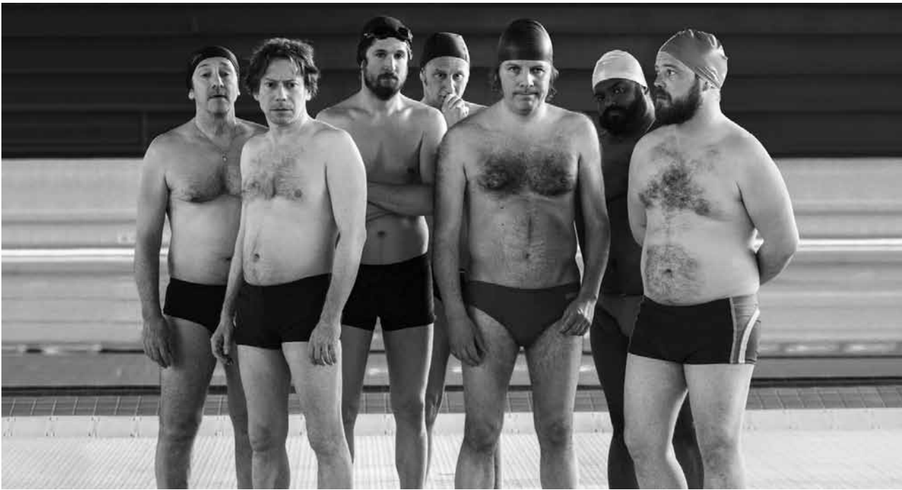
La vie est dure... elle peut même pousser toute une bande de mecs à se mettre à la natation synchronisée : « Le grand bain » - nouveau au Scala, Starlight et à l'Utopia.

Existenz. Den Beweis dafür erhält er, als er eines Tages auf den TV-Star Percy Patterson trifft.