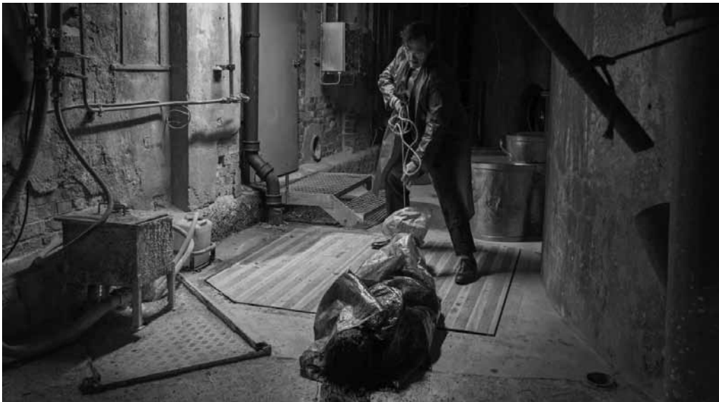
Jack célèbre son art...