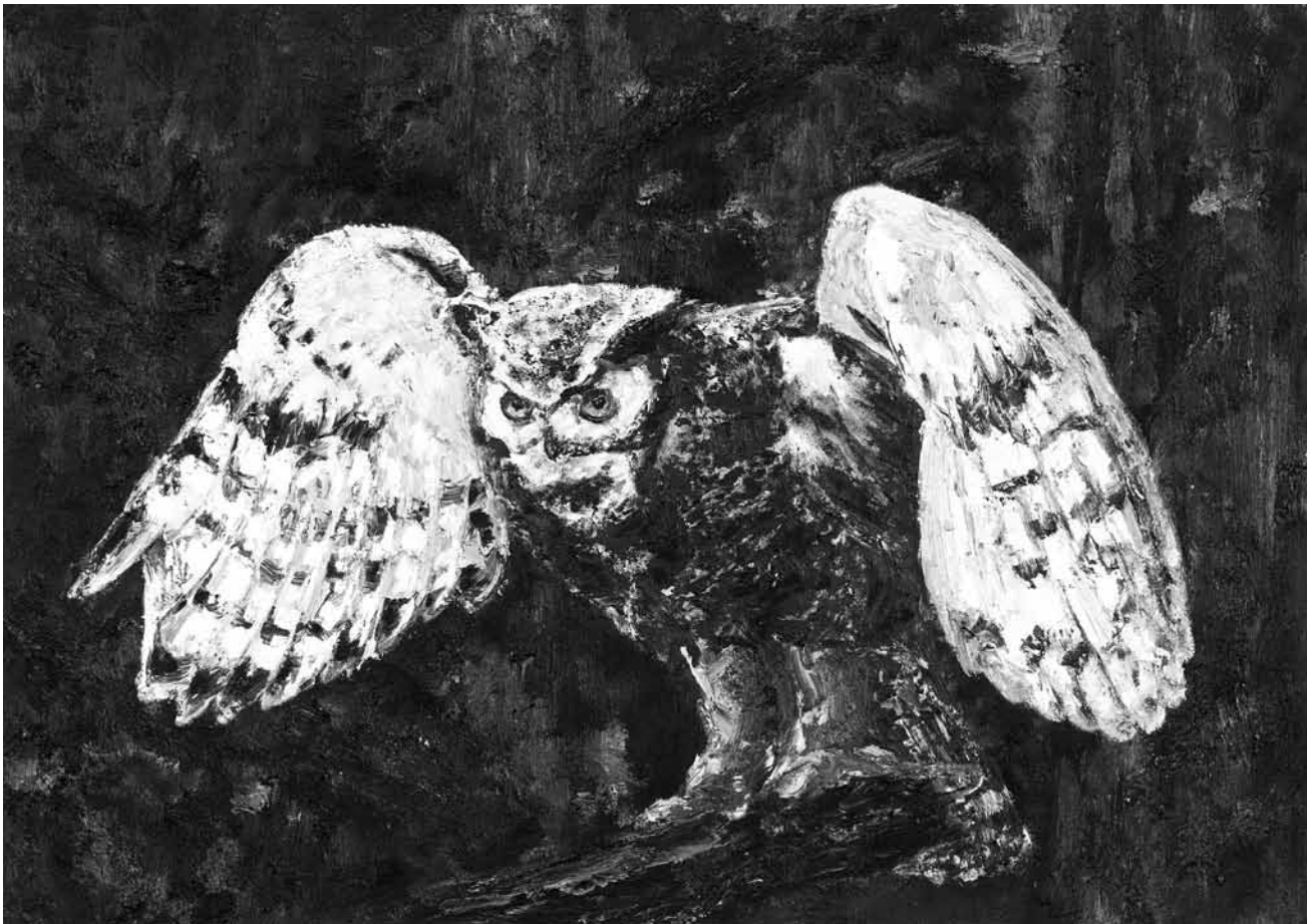
Das tut richtig weh! „Painful Painting“ - Roland Ophuis stellt noch bis zum 10. November in der Galerie Ceysson & Bénétière aus.