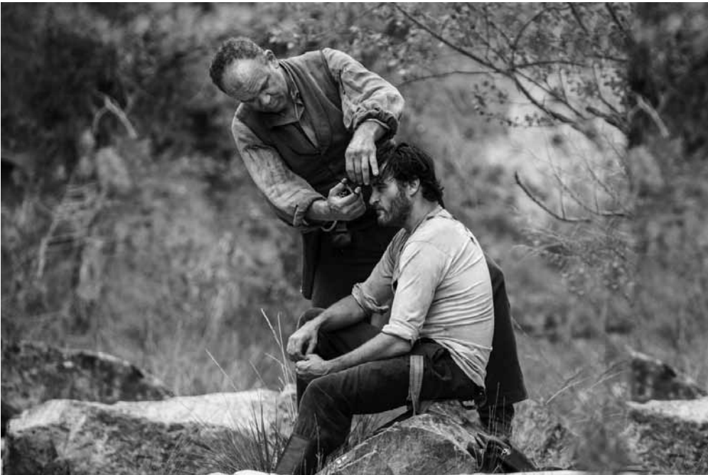
Deux frères inégaux qui se fraient un chemin dans une nature et une société sans pardon.