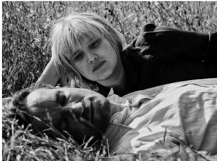
Eine Liebe in stürmischen Zeiten: „Zimna wojna (Cold War)“ - der polnische Oscar-Anwärterfilm ist neu im Kinopolis Belval und im Utopia.

✘✘ Grâce à une animation soignée, on suit avec émotion les aventures de Parvana, qui se travestit en garçon