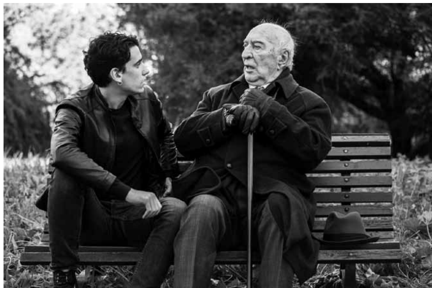
Une rencontre exceptionnelle entre un jeune révolté et un vieux poète : « Tutto quello che vuoi » - au Starlight les 3 et 7 novembre, dans le cadre du Festival du film italien de Villerupt.

Non loin de Trévise, sur de belles collines ensoleillées, pousse la vigne qui donne le prosecco. Desiderio Ancillotto, le comte, possède un vaste domaine et produit l'un des meilleurs vins de la région, en respectant sa terre et les règles anciennes. Il est en conflit avec Speggorin, le patron d'une cimenterie.