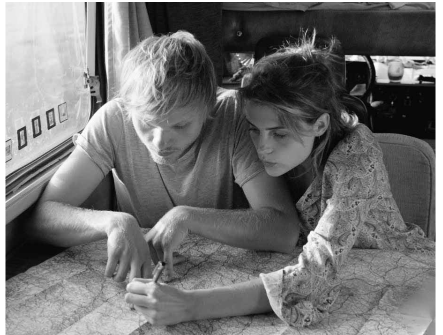
Ein Roadmovie, das droht als Schmonzette zu enden: „303“ von Hans Weingartner - im Utopia am 5. November.