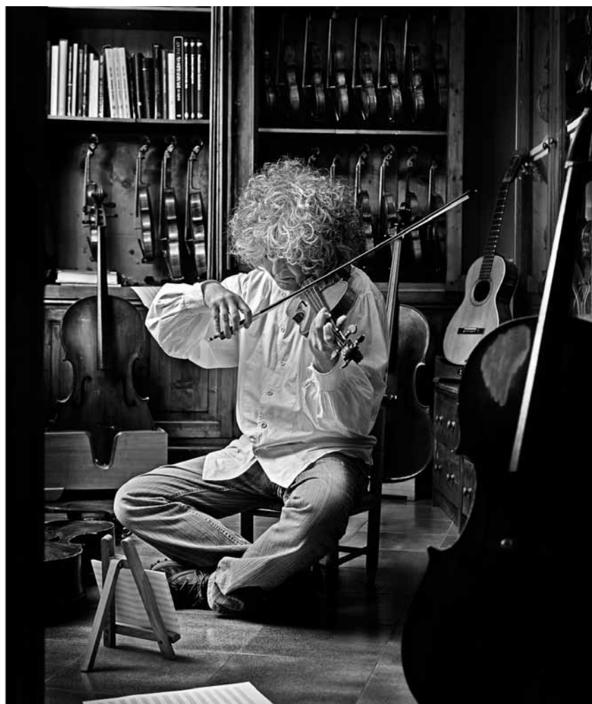
Il sait toujours se cacher derrière sa chevelure abondante : Angelo Branduardi passera le 5 novembre au conservatoire de la ville de Luxembourg.