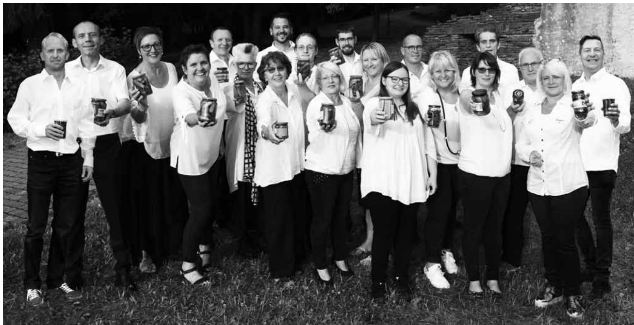
Et wäert wuel méi wéi just e bësse wackeleg ginn, den 9. an den 10. November an der Grondschoul Reenert zu Woltz: „Turbulente Wellegank op der Cornichonsyacht“, mat de Weeltzer Theaterfrënn.