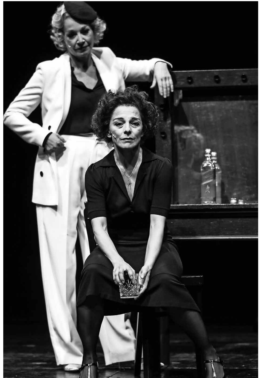
La Môme mal anders: „Piaf“ - Schauspiel mit Musik von Paul Gems, an diesem Samstag, dem 3. und am 11. November im Theater Trier.