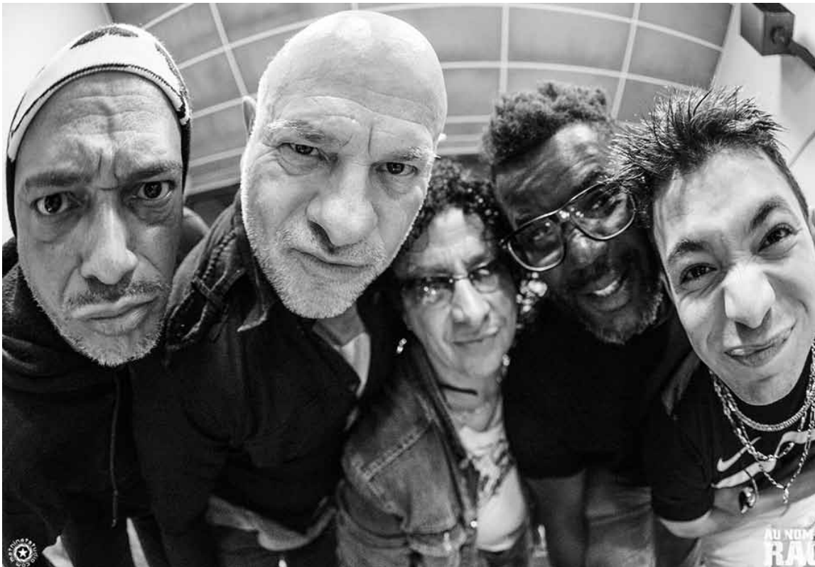
Trust, toujours à l'affût et toujours aussi en colère !