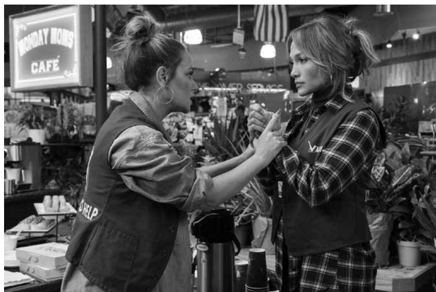
Ein US-Wintermärchen mit Jennifer Lopez: In „Second Act“ versucht eine Supermarkt-Filialeiterin sich nach oben zu mogeln - neu im Kinepolis Kirchberg.

Der Grinch ist ein grüner, zynischer Miesepeter, der gemeinsam mit seinem treuen Hund Max in einer Höhle oberhalb des Dörfchens Whoville lebt, wo man Weihnachten über alles liebt. Der Griesgram hasst jedoch das Weihnachtsfest mehr als alles andere und findet die ausgelassenen Feierlichkeiten der Dorfbewohner fürchterlich. Also beschließt er, die Feierlichkeiten zu sabotieren und Weihnachten zu stehlen.