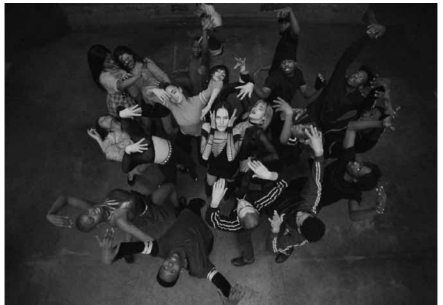
Première expérience forte de l'année : « Climax », le nouveau film de l'enfant terrible Gaspard Noé sur un groupe de danseuses et danseurs intoxiqué-e-s mystérieusement - à l'Utopia dans le cadre d'« Out of the Box ».