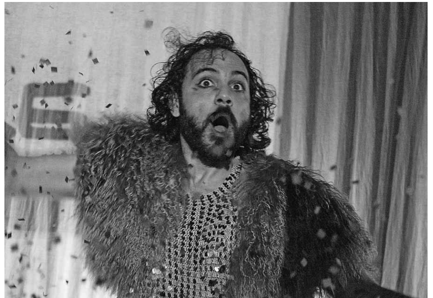
Dramatisches auch im neuen Jahr: „Mélodie! Maladie! Mélodrame!“ – ein weiterer Abend über Ingrid Caven frei nach Jean-Jacques Schuhl – am 5. Januar in der sparte4 in Saarbrücken.