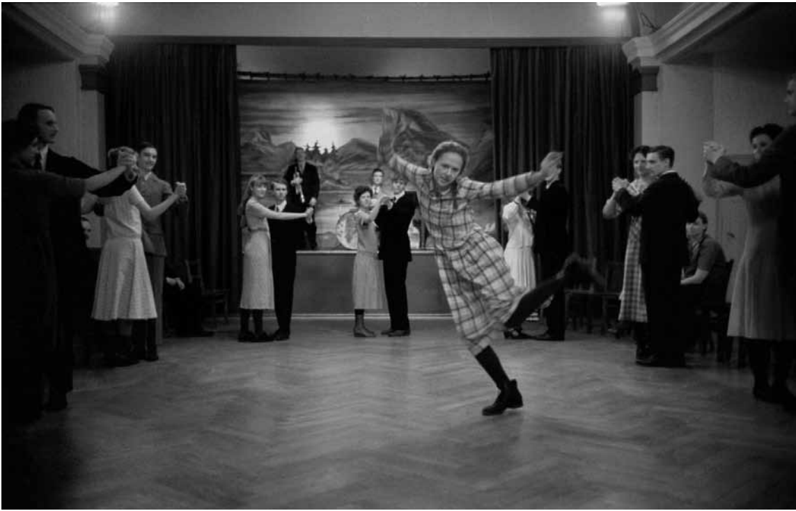
Wildes Herumtanzen in der muffigen schwedischen Provinz: Auch die junge Astrid Lindgren war schon... etwas anders.