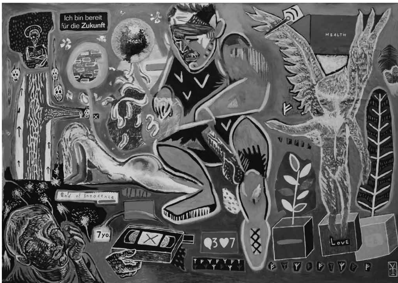
Manger tout en admirant de l'art, c'est possible au restaurant Come prima à Luxembourg avec « End of Innocence » de Victor Tricar - jusqu'au 16 mars.

Tél. 26 20 15 10), jusqu'au 5.2, ma. - sa. 10h30 - 12h30 + 13h30 - 18h.