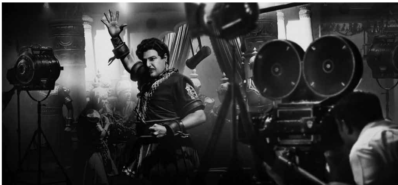
Bollywood mal hinter den Kulissen: „NTR: Kathanayakudu“ erzählt vom Aufstieg des Schauspielers und Regisseurs Rao Nandamuri - am 19. Januar im Kinepolis Kirchberg.