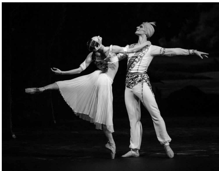
Indian temple dancers, warriors and much more await at the Kinopolis Belval and Kirchberg with the live transmission of "La bayadère" from the Bolshoi, on January 20th.