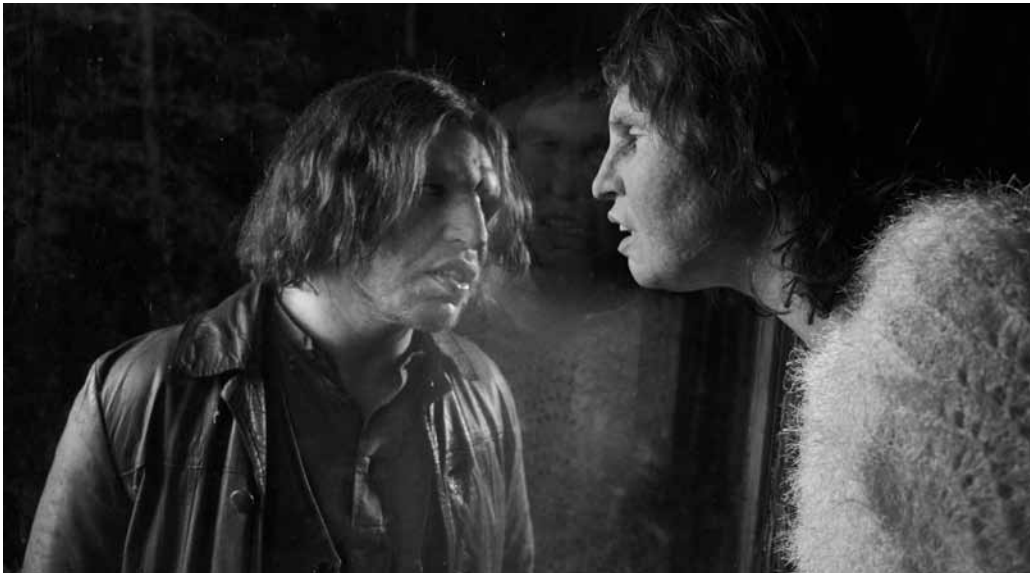
Une rencontre prodigieuse entre deux êtres pas comme les autres.