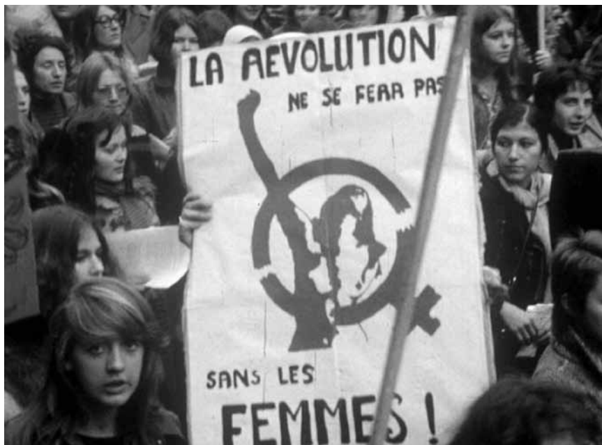
Un pan de l'histoire qui ne fait toujours pas partie de la mémoire officielle: "Histoire(s) de femme(s)" - le documentaire d'Anne Schroeder est toujours au Starlight.

sitzt inzwischen hinter Schloss und Riegel. Da hört Dunn aus den Nachrichten von einem entflohenen Psychopathen, der mehrere Mädchen getötet hat. Kevin Wendell Crumb, der 23 unterschiedliche Persönlichkeiten in sich beheimatet, hat seine letzte, die 24. Form angenommen: das Biest. X Ce film était censé donner une cohérence à sa filmographie et revisiter le genre du superhéros. Le résultat est en demi-teinte : un film plus psychologique que spectaculaire, mais desservi par une fin lourdingue qui célèbre la loi du plus fort. (Vincent Artuso)