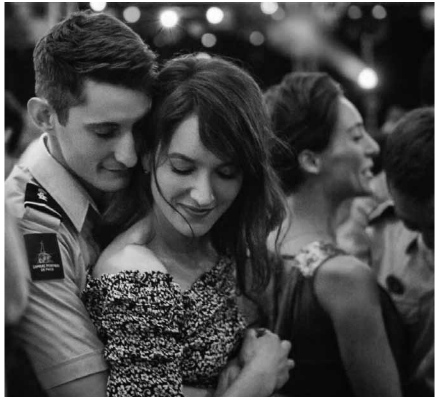
Sapeur-pompier, un métier de rêve qui peut virer au cauchemar : « Sauver ou périr » de Frédéric Tellier - le 10 février au Kinoler.