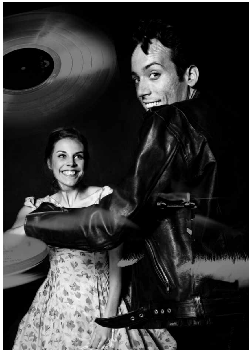
Mit „Blue Jeans“ können Nostalgiker*innen noch mal ins Nachkriegsdeutschland der 1950er-Jahre reisen (garantiert ohne Adenauer) - das Musical kommt am 10. Februar ins Theater Trier.

Beziehungen und andere Katastrophen , Lesung der Autorengruppe Scriptum Trier, Tufa,