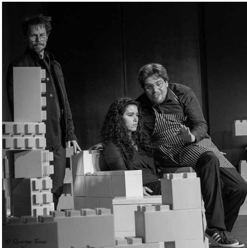
Die Wiederaufnahme von Sybille Bergs „Viel gut essen“ am 12. und am 13. Februar im Escher Theater.

Peer Gynt , von Henrik Ibsen, inszeniert von Roberto Ciulli und