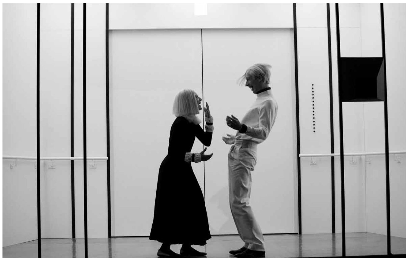
Mit „Der Streit“ wird am Saarländischen Staatstheater ein Stück von Marivaux frisch aufgezogen - am 8. Februar.

Les couteaux dans le dos , texte et mise en scène de Pierre Notte, Théâtre du Saulcy, Metz (F),