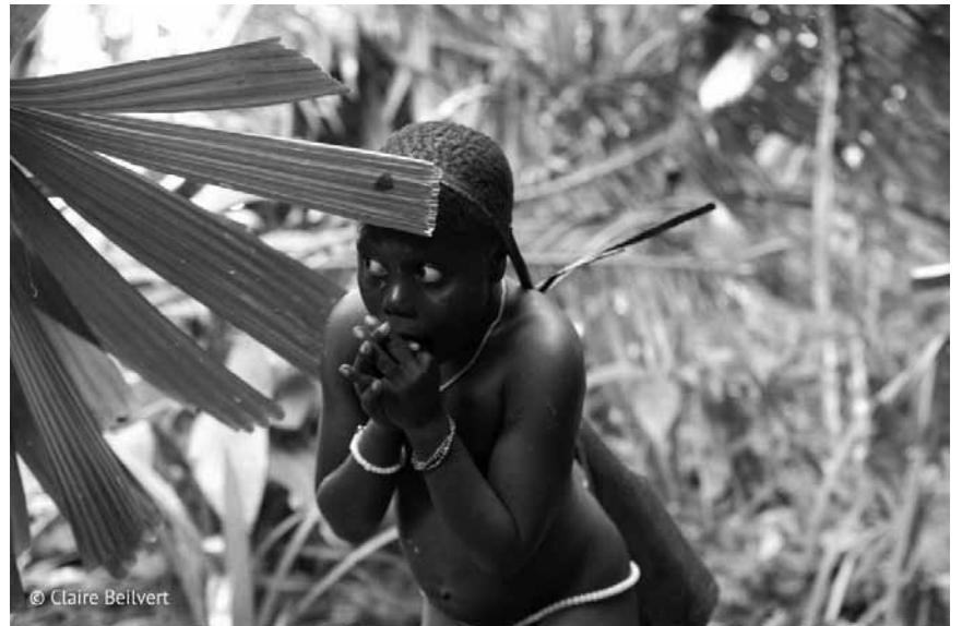
They may not be the Sentinelese, but the Jarawa tribe in India is as threatened as their more isolated sisters and brothers. Meet them in the documentary "We Are Humanity" - on February 19th at the Kinosch.