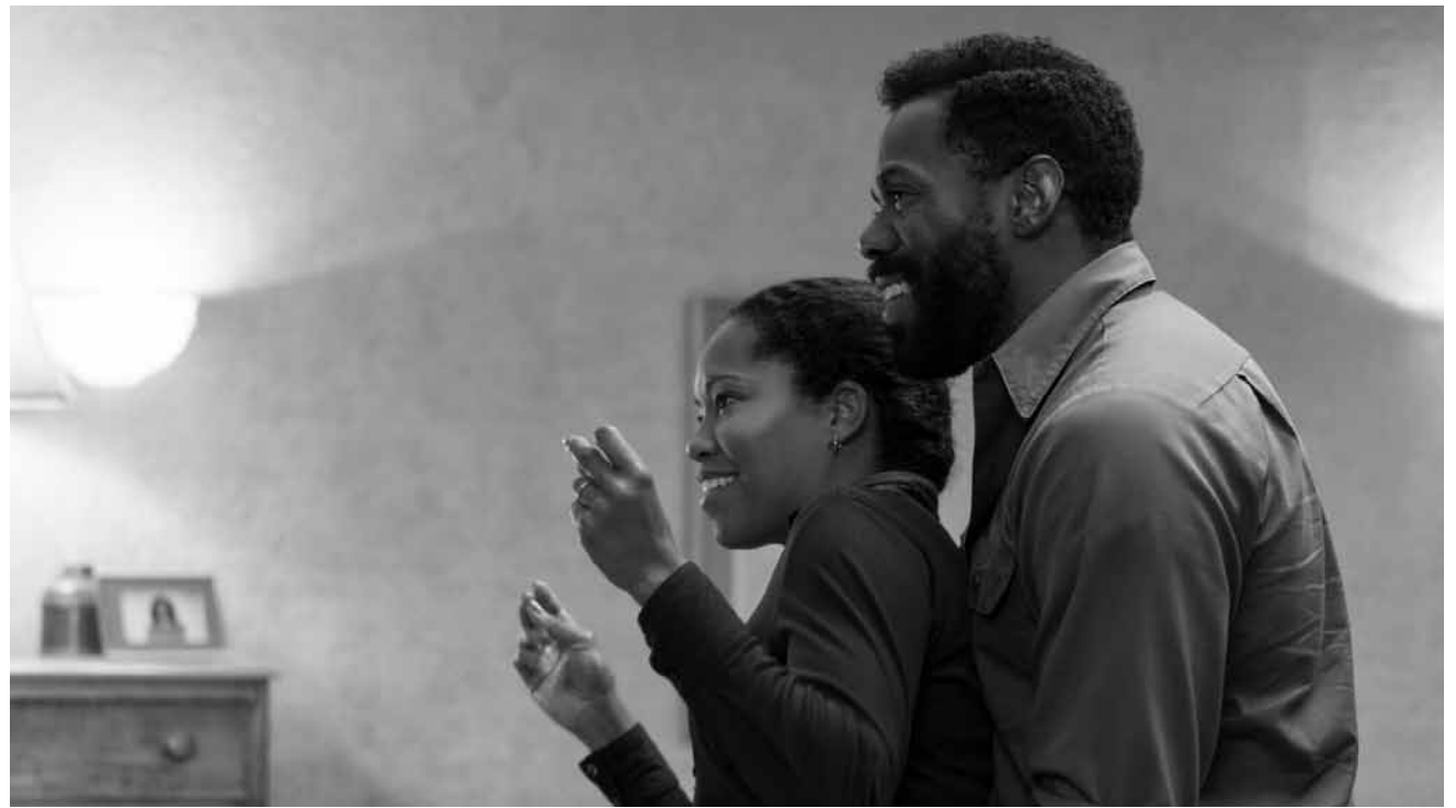
Nach James Baldwins Buch: „If Beale Street Could Talk“ nimmt uns mit auf eine Zeitreise ins Harlem der 1970er-Jahre - neu im Utopia.

✘✘✘ Dans chaque guerre, c'est la vérité qui meurt la première. Dans « Donbass », au moins, elle crève de rire... Ce film exceptionnel, grinçant et brutal ne va certainement pas plaire à celles et ceux qui se positionnent pour ou contre les belligérant-e-s (ami-e-s de RT et de Sputnik s'abstenir), mais il est une formidable leçon d'humanité. (Ic)