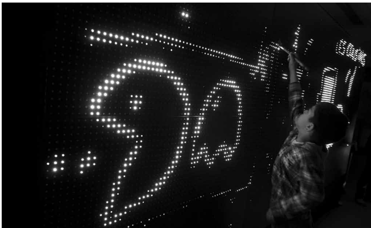
Du graffiti à l'eau et en numérique : c'est le « Waterlight Graffiti » d'Antonin Fourneau, visible du 1er au 3 mars aux Rotondes dans le cadre du festival Multiplica - et puis encore jusqu'en février 2020 !