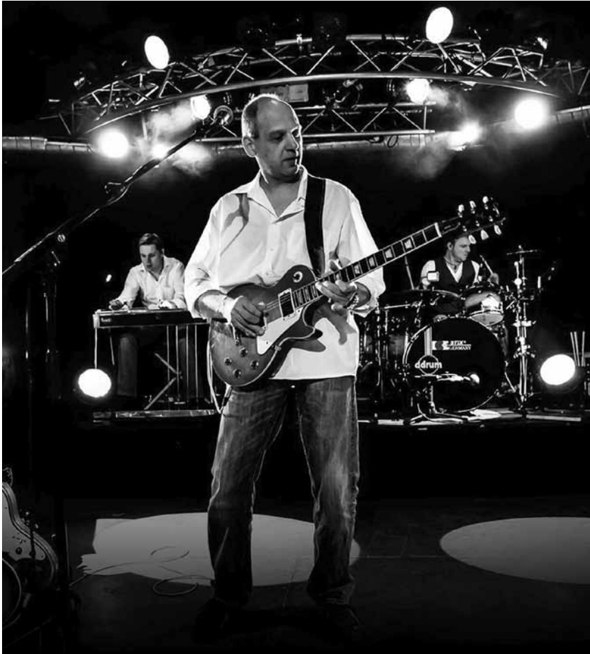
Die Dire Straits oder besser gesagt deren Tribute-Band Brothers in Arms kann man am 1. März im Duksaal in Freudenburg erleben.

Orchestre national de Metz , sous la direction de David Reiland, avec Lukas Vondracek (piano), œuvres d'Adams, Rachmaninov et Stravinski, Arsenal, Metz (F), 20h. Tél. 0033 3 87 74 16 16. www.citemusicale-metz.fr