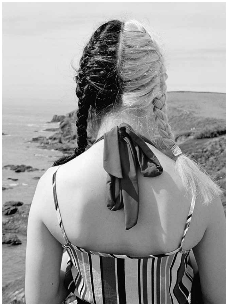
Il y a toujours moyen de s'échapper : « Exit », les photographies d'Isabelle Graeff sont à l'Échappée belle à Clervaux jusqu'au 27 septembre.