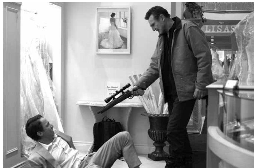
Liam Neeson ist schon wieder (oder immer noch) auf einem Rachtetrip, diesmal im Schnee: „Cold Pursuit“ neu im Kinopolis Belval und Kirchberg.

F 2019 de Félix Moati. Avec Vincent Lacoste, Benoît Poelvoorde et Mathieu Capella. 90'. V.o. À partir de 6 ans.