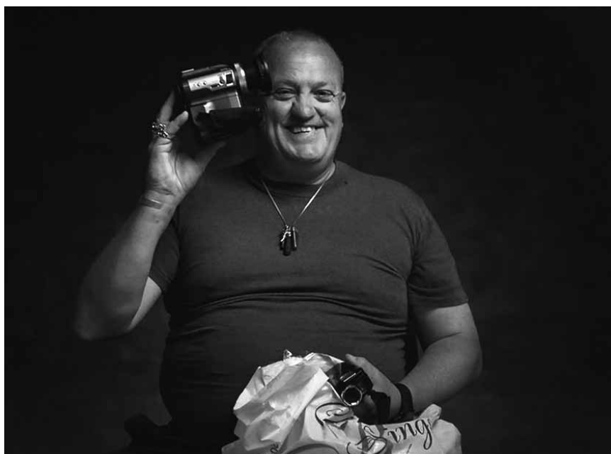
Ein Geisterjäger auf der Suche nach seiner eigenen Vergangenheit: „Ghosthunter“ - am 9. März im Utopia im Rahmen des Luxfilmfest.

Lou et Chantal, deux adolescentes à la langue trop bien pendue, ne supportent plus le village canadien paumé et délabré où elles vivent. Insolentes et volcaniques, les deux meilleures amies traînent leur jeunesse entre alcool, drogue, misère sociale et ennui, et ne rêvent que d'une chose : partir.