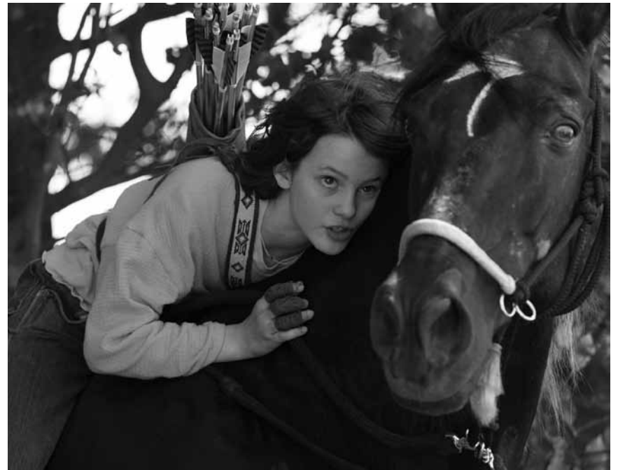
Das Leben ist doch ein Ponyhof... manchmal: „Ostwind 4: Aris Ankunft“ ist neu im Kinepolis Belval und Kirchberg.

Durch ihre Ehe mit Franz II. wird Maria Stuart 1559 zur Königin von Frankreich. Als ihr Mann nur zwei Jahre später stirbt, weigert sie sich, erneut zu heiraten. Stattdessen beschließt sie, in ihre Heimat Schottland zurückzukehren und den Thron zu besteigen, der rechtmäßig ihr gehört. Doch die schottische Krone trägt mittlerweile Elisabeth I; die zugleich auch Königin von England ist. Es kommt zu einem Machtkampf zwischen den beiden Monarchinnen.