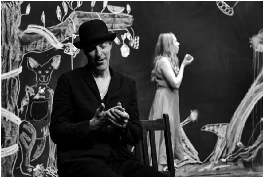
Für Kinder die andauernd Fragen stellen und Eltern die nicht mehr weiterwissen: „Am Anfang“ vom Theater Mumpitz kann da helfen - am 14. März im Cape Ettelbrück.