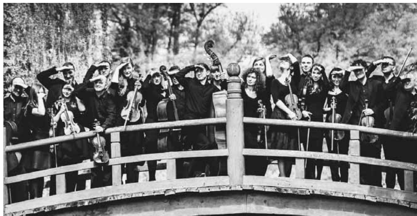
Le Leo Chamber Orchestra originaire de Wroclaw en Pologne réjouira les fidèles de musique classique ce vendredi 8 mars en l'église Saint-Pierre-et-Saint-Paul de Nieder Korn.