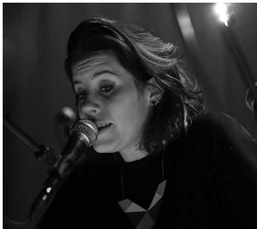
Der Claudine Muno hiert Lauschterstéck „Wou ginn Elteren nuets hin“ ass dëse Sonndeg, den 10. Mäerz zu Niederanven an de 16. an de 17. am Escher Theater.

Saties Welt , inszeniertes Konzert (9-12 Jahre), Philharmonie, Luxembourg, 15h. Tél. 26 32 26 32. www.philharmonie.lu