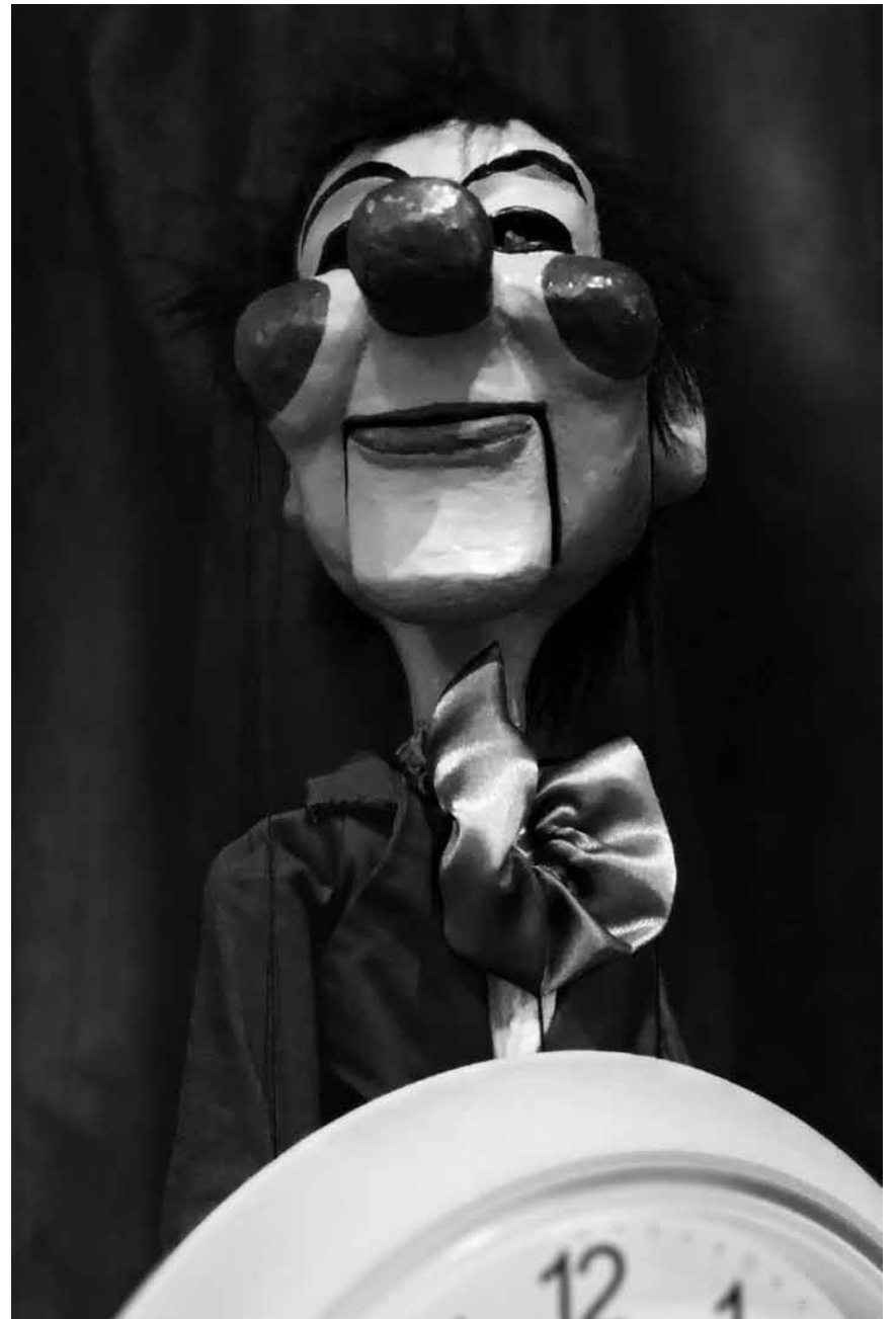
De Bimbo Theater ass nach den 9., 10., 12., 14., 16. an de 17. Mäerz „Op der Sich no der Zäit“ - am Sang a Klang Pafendall.

Vous organisez une expo ou un événement et vous voudriez l'annoncer dans le woxx ? Envoyez-nous toutes les informations nécessaires à agenda@woxx.lu Date limite d'envoi pour le numéro 1514 (15.3 - 24.3) : me. 13.3, 9h.