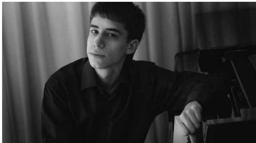
L'Orchestre national de Metz et le pianiste Vitaly Starkov invitent à redécouvrir Beethoven et Brahms le 16 mars au Cape.

Volti subito , quatuor à cordes, œuvres de Haydn et Mozart, centre culturel Altrimenti, Luxembourg , 17h. Tél. 28 77 89 77. www.altrimenti.lu