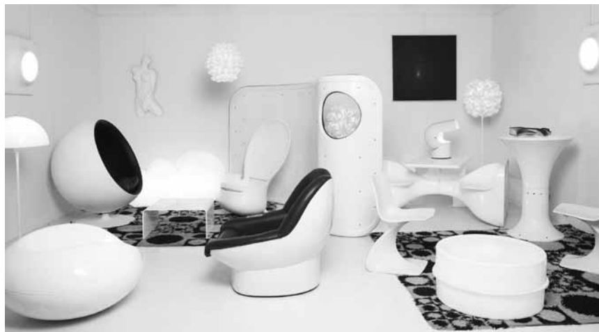
Plus qu'un vide-grenier : le Salon du vintage, avec plus de 100 exposant-e-s, se tiendra au Luxexpo - The Box ce weekend, les 16 et 17 mars.