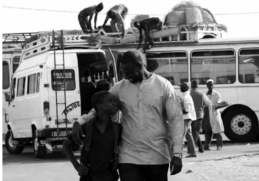
Dans « Yao », un petit garçon emmène un célèbre acteur sur les terres de ses ancêtres - nouveau à l'Utopia.

der Küste verbringen. Doch als die Wilsons mit ihren Freunden zurück in ihrem Ferienhaus sind, nähern sich am Abend plötzlich seltsame und furchteinflößende Gestalten. Die ungebetenen Besucher jagen ihnen nicht nur große Angst ein, sie sehen den einzelnen Familienmitgliedern auch verstörend ähnlich.