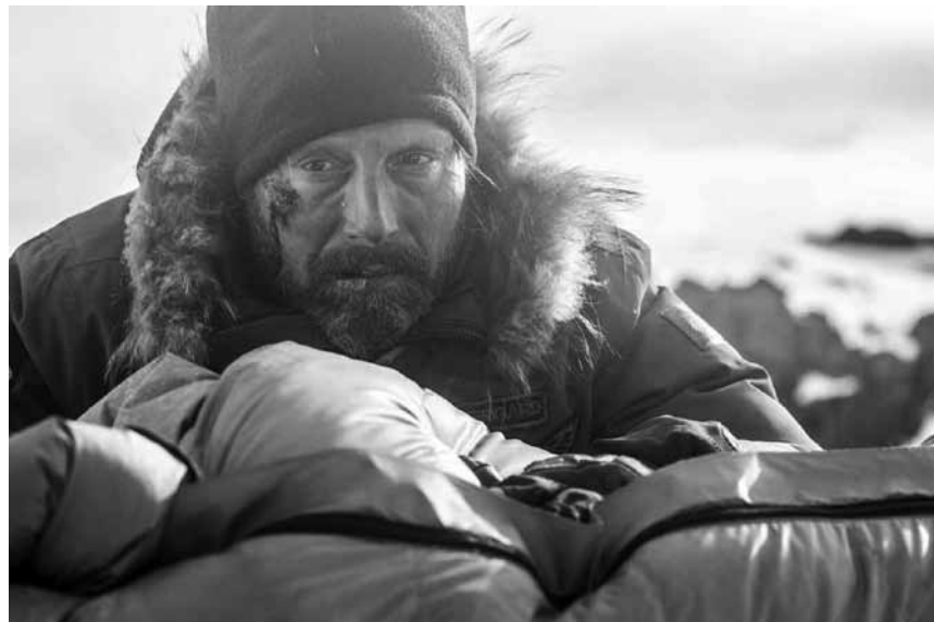
Solange sie nicht gänzlich weggeschmolzen ist, bleibt die Arktis ein gefährliches Terrain: „Arctic“ - neu im Utopia.

Im Jahr 1970 gründen Freddie Mercury, Brian May, Roger Taylor und John Deacon die Band Queen. Schnell