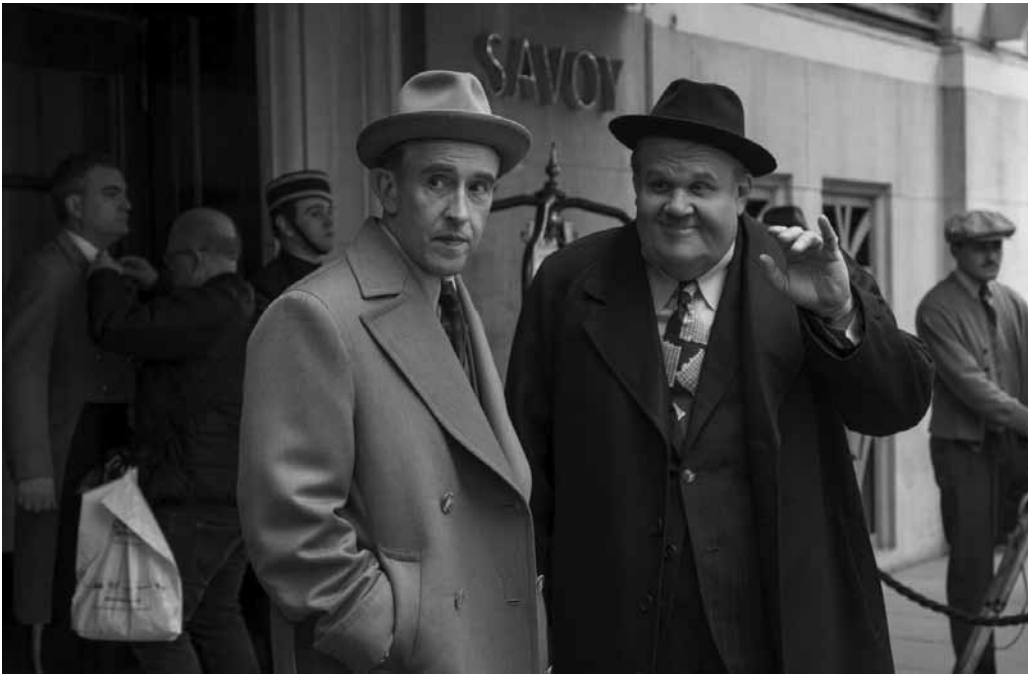
Une dernière aventure pour deux légendes vivantes.