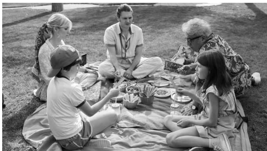
Comment ne pas décevoir son fiston quand le compte en banque est à plat : « El mejor verano de mi vida », comédie sur l'existence précaire, sera au Kinosch ce samedi 23 mars.