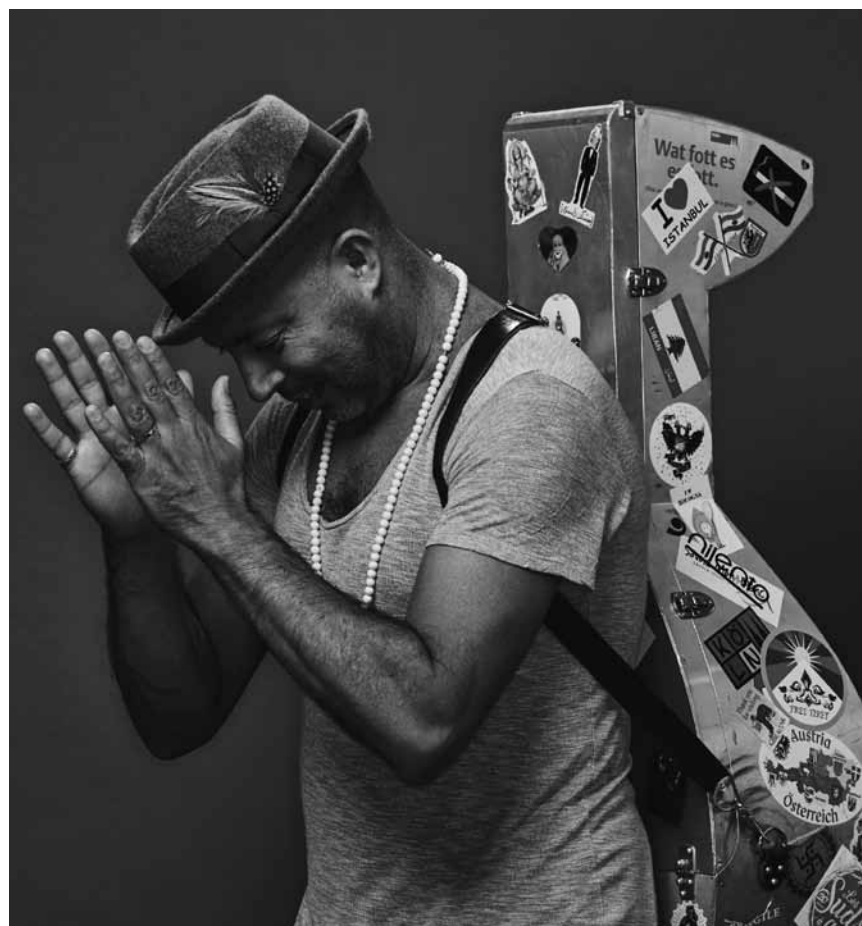
Wunderbaren Jazz mit tunesischem Einschlag bringt das Dhafer Youssef Quartett an diesem Samstag, dem 30. März nach Marnach in den Cube521.

Tamas Vamos , stand up comedy, De Gudde Wëllen, Luxembourg , 19h30. www.deguddewellen.lu