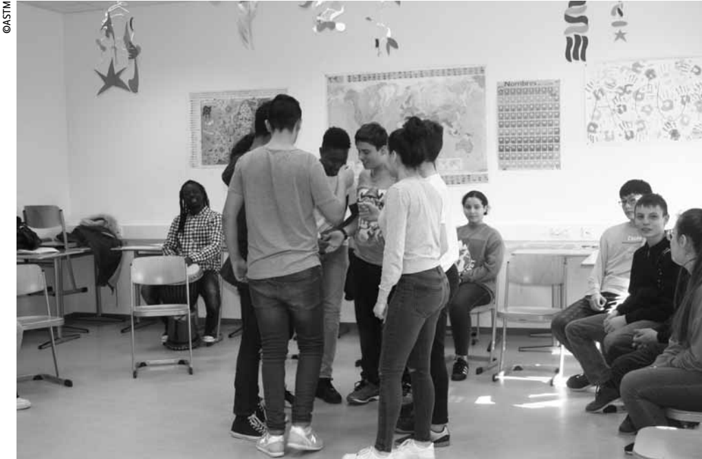
Travail collectif en salle de classe avant la grande soirée ce vendredi.