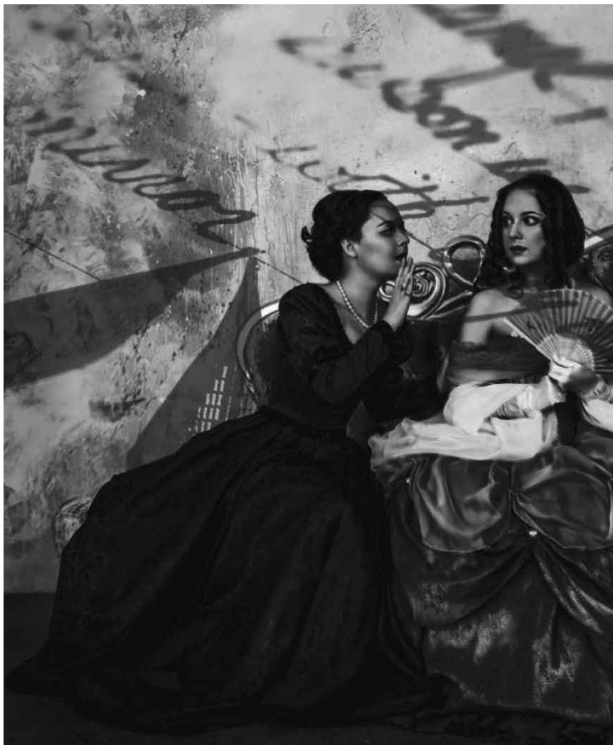
Schmonzetten, Intrigen und andere kostümierten Köstlichkeiten erwarten das Publikum mit „Die lustigen Weiber von Windsor“ - am 6. April im Theater Trier.

Théâtre national du Luxembourg, Luxembourg , 20h. Tél. 26 44 12 70-1. www.tnl.lu