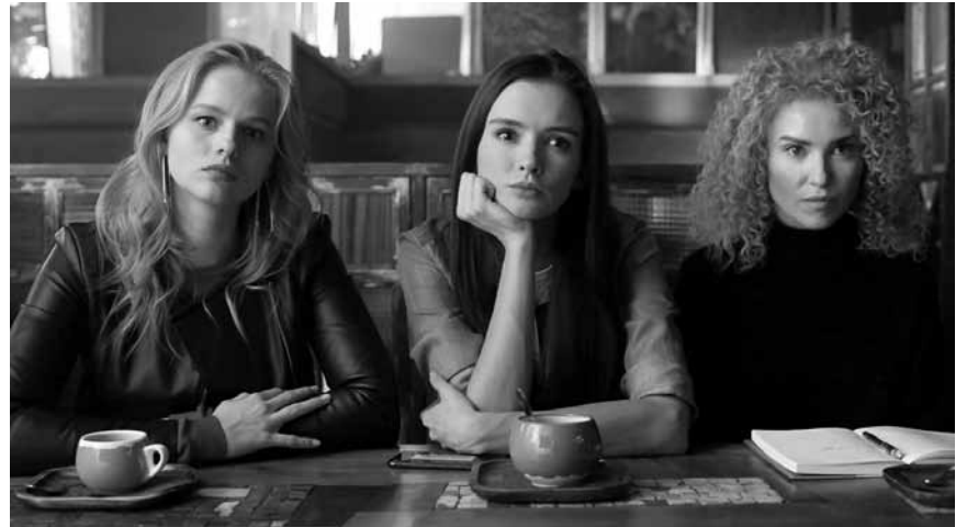
A secret society to defend deceived women? A seducing idea in today's Russia ... or anywhere else, for that matter. "Lyubovnitsy", special screening on this Sunday, April 7th at the Kinopolis Kirchberg.