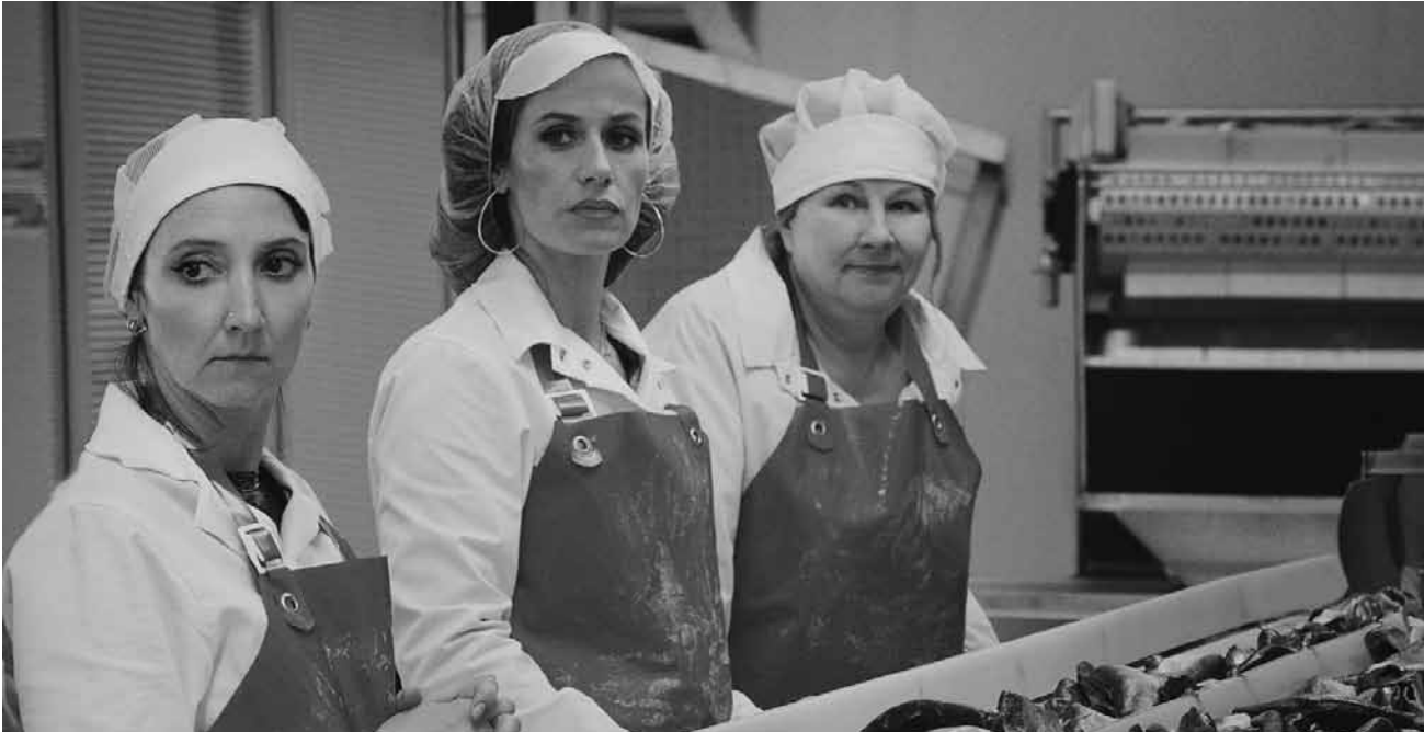
Un travail aliénant dans une conserverie qui mène au crime : l'argument de « Rebelles » n'est pas banal.