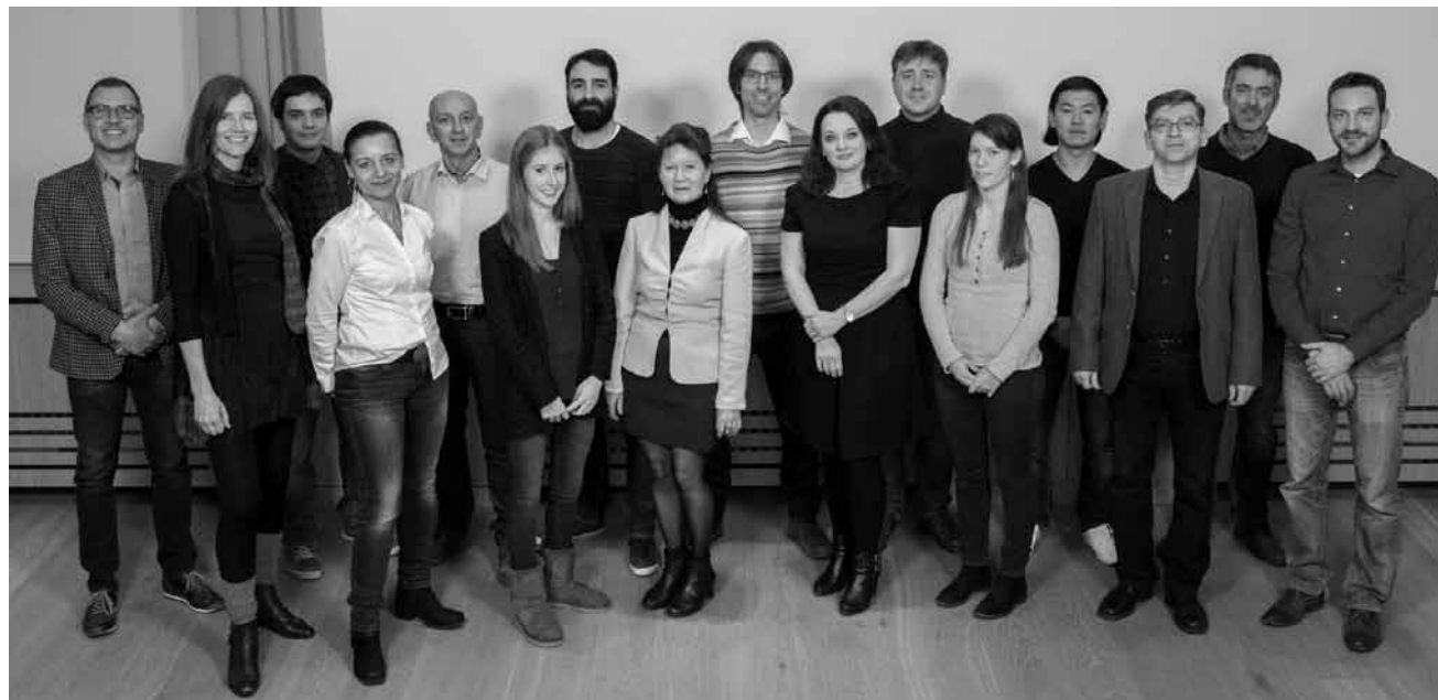
L'Aalt Stadhaus de Differdange invite les enseignant-e-s de l'école de musique de la commune à se produire sur scène, ce vendredi 5 avril.