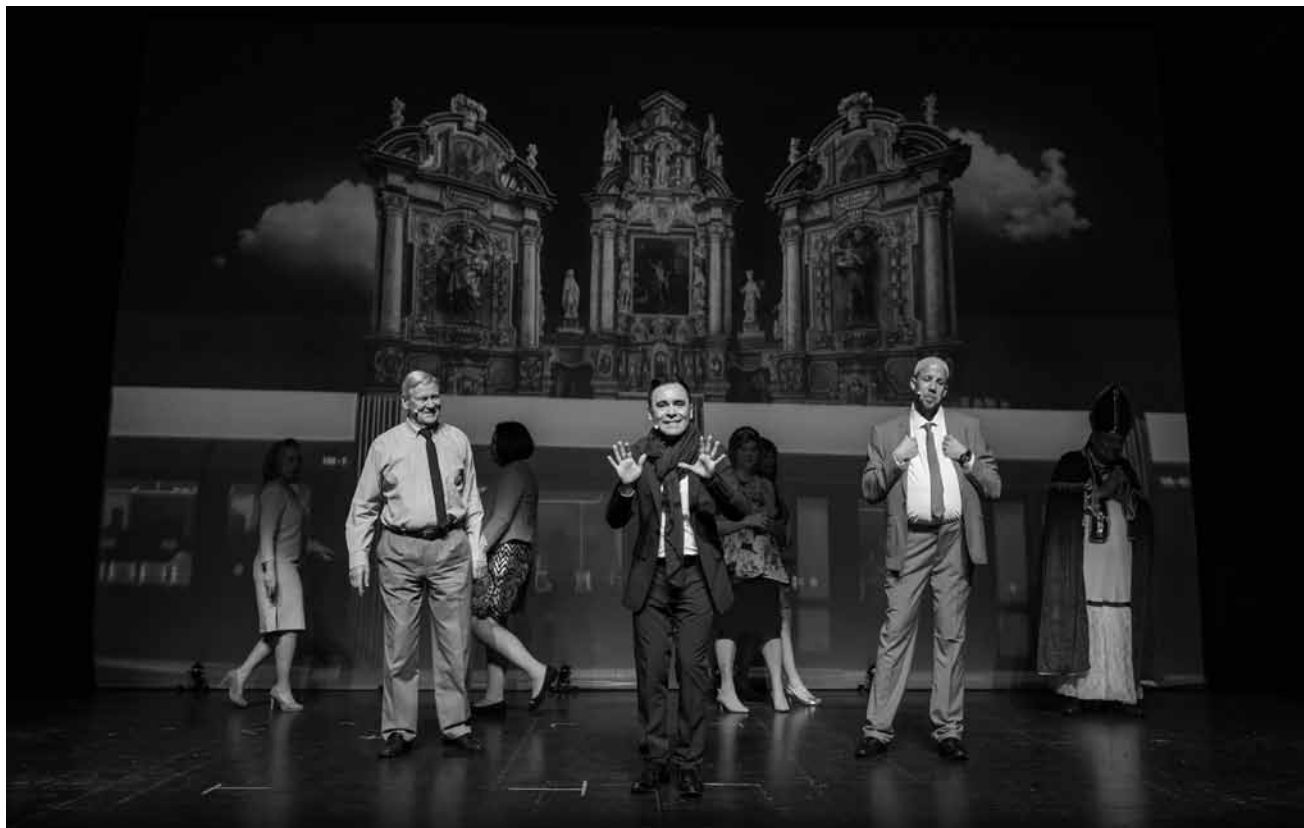
D'Nei Revue asbl steet wéi gewinnt mat hirem aktuelle Programm ob verschiddene Bühnen a léisst dat lescht Joer Revue passéieren. Vum 24. bis de 27. Abrëll assi se am Centre des arts pluriels zu Ettelbréck ze erliwien.

Luxembourg, 14h30. Tel. 45 37 85-1. www.mudam.lu