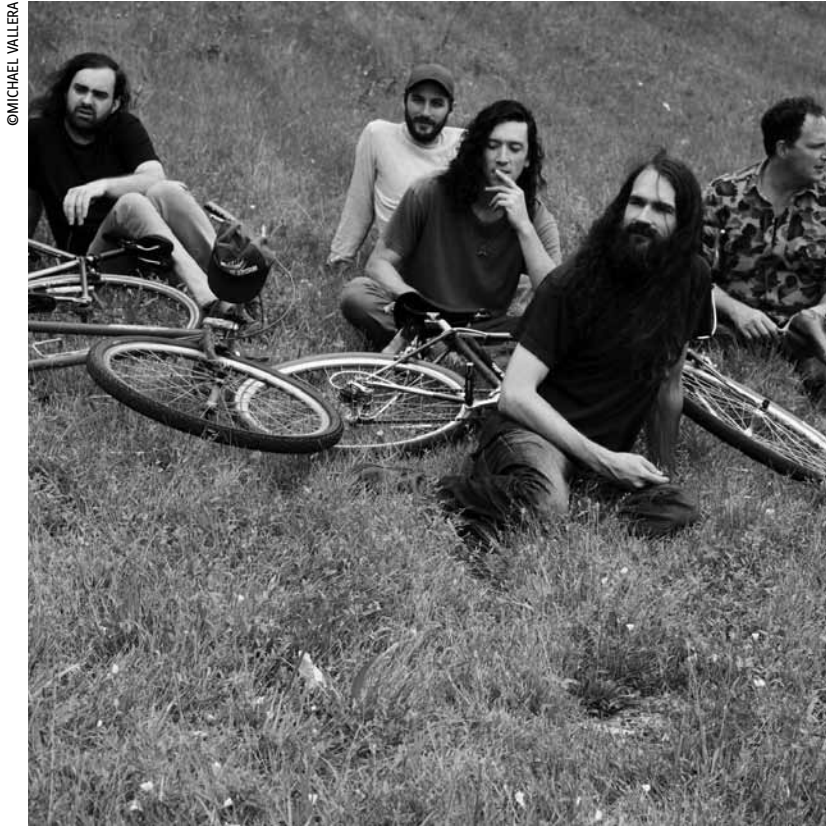
Mehr als verdammte Hippies: Cave.