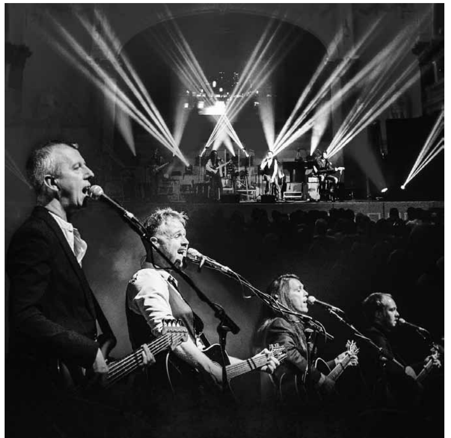
Ob auch sie das Hotel California finden werden? - „Ultimate Eagles“ - Die Eagles-Tribute-Band tritt am 19. April im Artikuss in Soleuvre auf.