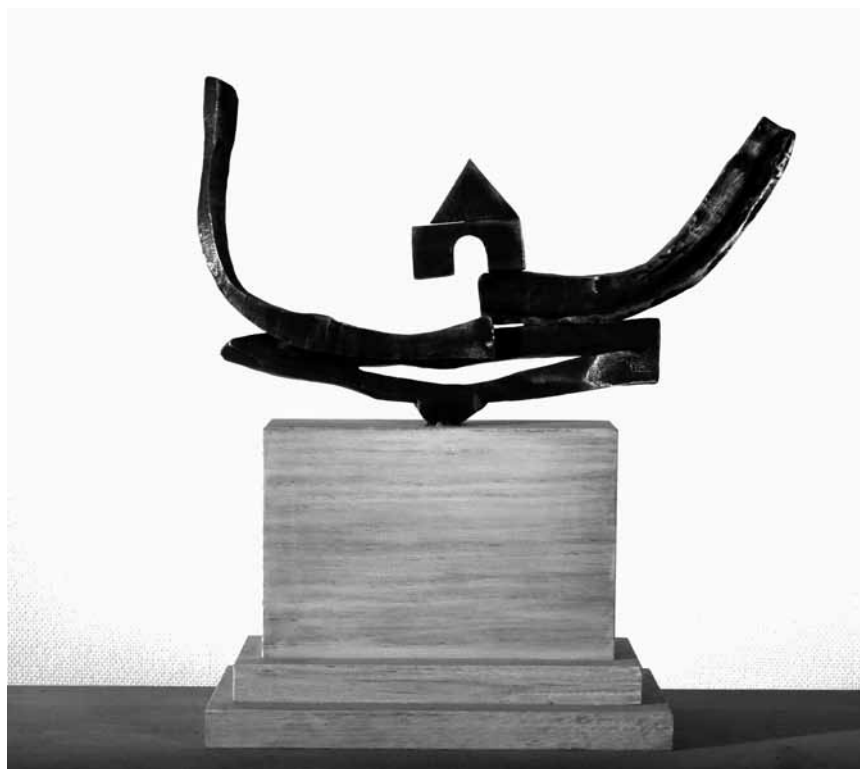
L'artiste tchèque Iva Mrazkova n'est pas une inconnue au grand-duché : sa dernière expo en date est à visiter jusqu'au 19 mai à la Millegalerie de Beckerich.