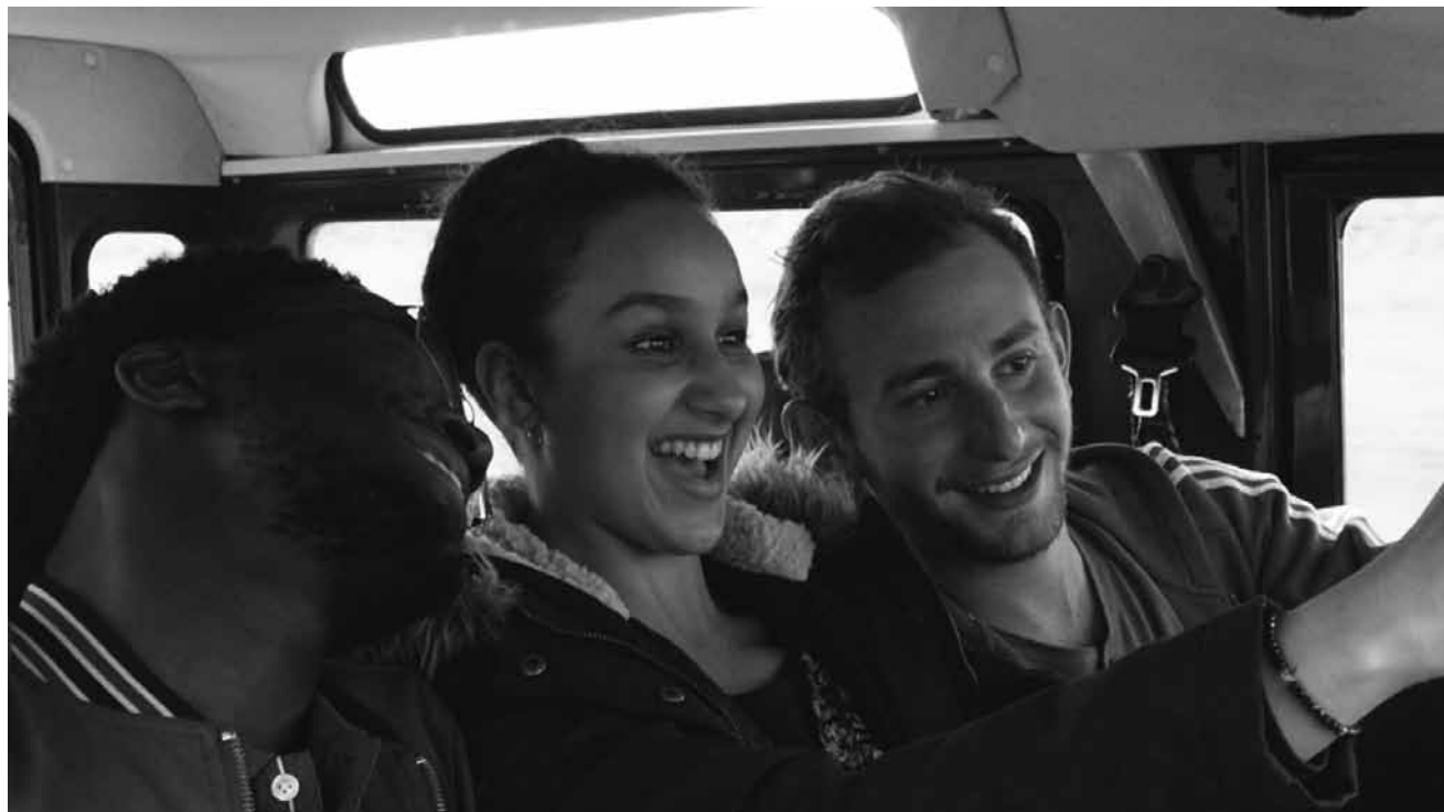
Quand ton petit-fils veut rejoindre Daech... « L'adieu à la nuit », d'André Téchiné, est nouveau à l'Utopia.

Alexandre vit à Lyon avec sa femme et ses enfants. Un jour, il découvre par hasard que le prêtre qui a abusé de lui aux scouts officie toujours auprès d'enfants. Il se lance alors dans un combat, très vite rejoint par François et Emmanuel, également victimes du prêtre, pour « libérer leur parole » sur ce qu'ils ont subi. Mais les répercussions et conséquences de ces aveux ne laisseront personne indemne.