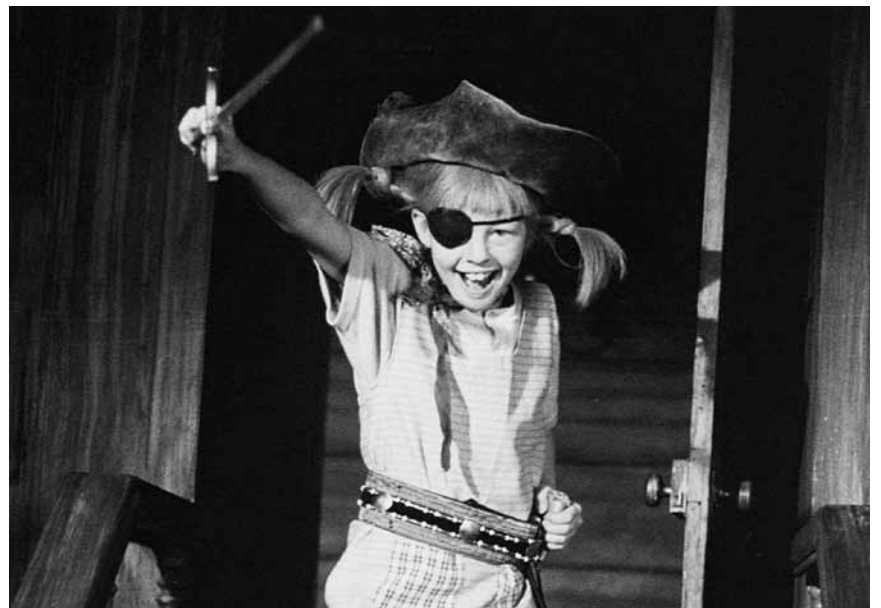
Als die Piraten noch keine Partei waren: „Pippi im Taka-Tuka-Land“ - der Klassiker von 1970 läuft am 30. April im Scala.