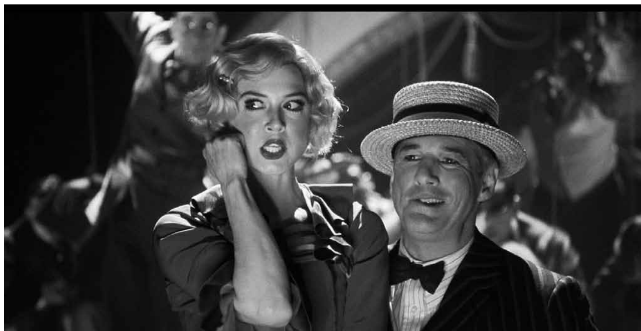
Singen, um aus dem Knast zu kommen, ist in „Chicago“ wörtlich gemeint – an diesem Samstag, dem 27. April in der Cinémathèque.