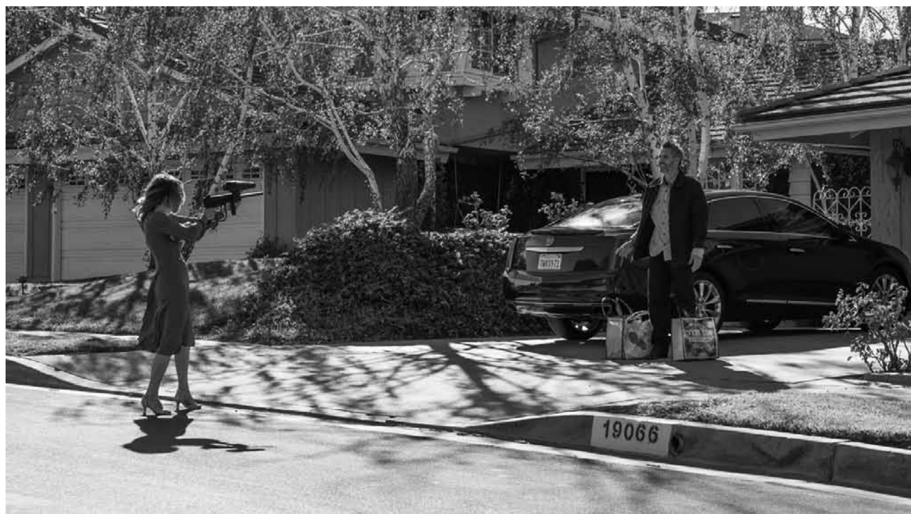
Single Frau um die 50 muss feststellen, dass frisch durchstarten nicht immer das Einfachste ist: „Gloria Bell“ - neu im Utopia.

❖ La magie Tim Burton opère-t- elle dans cette nouvelle version du classique de Disney ? En partie, grâce à la désormais bien connue invention visuelle du cinéaste. Mais l'intrigue, malgré l'ajout de personnages, est relativement prévisible et le cabotinage d'une partie de la distribution peut aussi énerver.