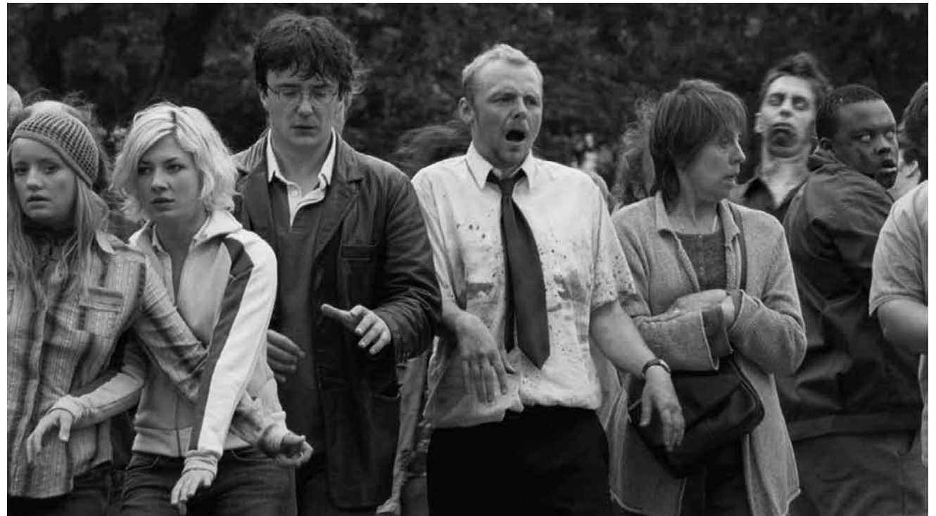
Wohl einer der lustigsten Zombie-Filme der je gedreht wurden: „Shaun of the Dead“, am 6. Mai in der Cinémathèque.

À sa sortie d'un centre psychiatrique, Ricki rêve de mener une vie normale auprès de Marina, une star de films érotiques avec laquelle il a eu précédemment une brève aventure. Il force son appartement et, devant ses réticences, n'hésite pas à la ligoter sur son lit.