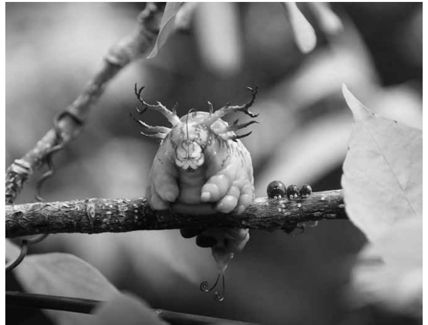
La vie des insectes est courte, mais pas de tout repos non plus : « Minuscule 2 - Les mandibules du bout du monde », nouveau à l'Utopia.