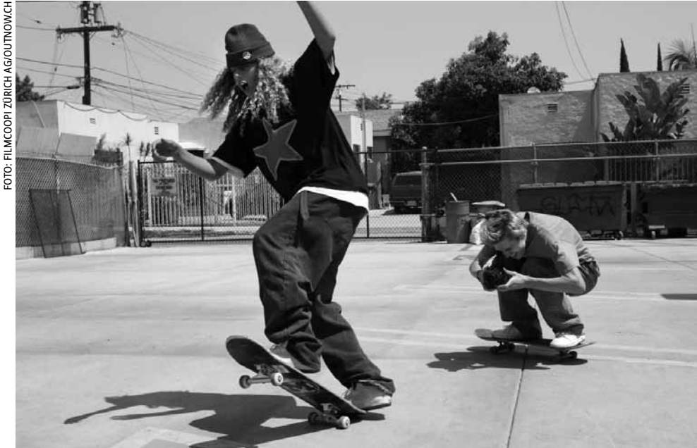
Fuckshit und Fourth Grade verbringen jeden Tag mit Skaten und Filmen.