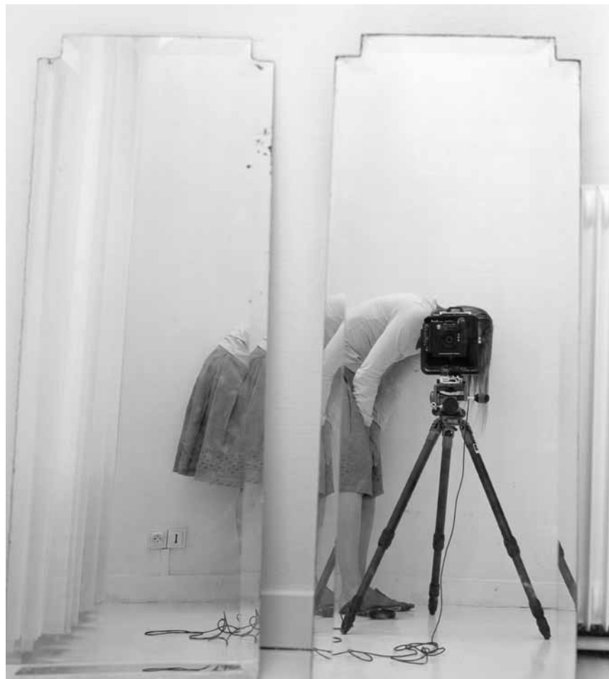
La photographe finlandaise Elina Brotherus est l'invitée de la Villa Vauban pour le Mois européen de la photographie - du 17 mai au 13 octobre.

Dans le cadre du Mois européen de la photographie.