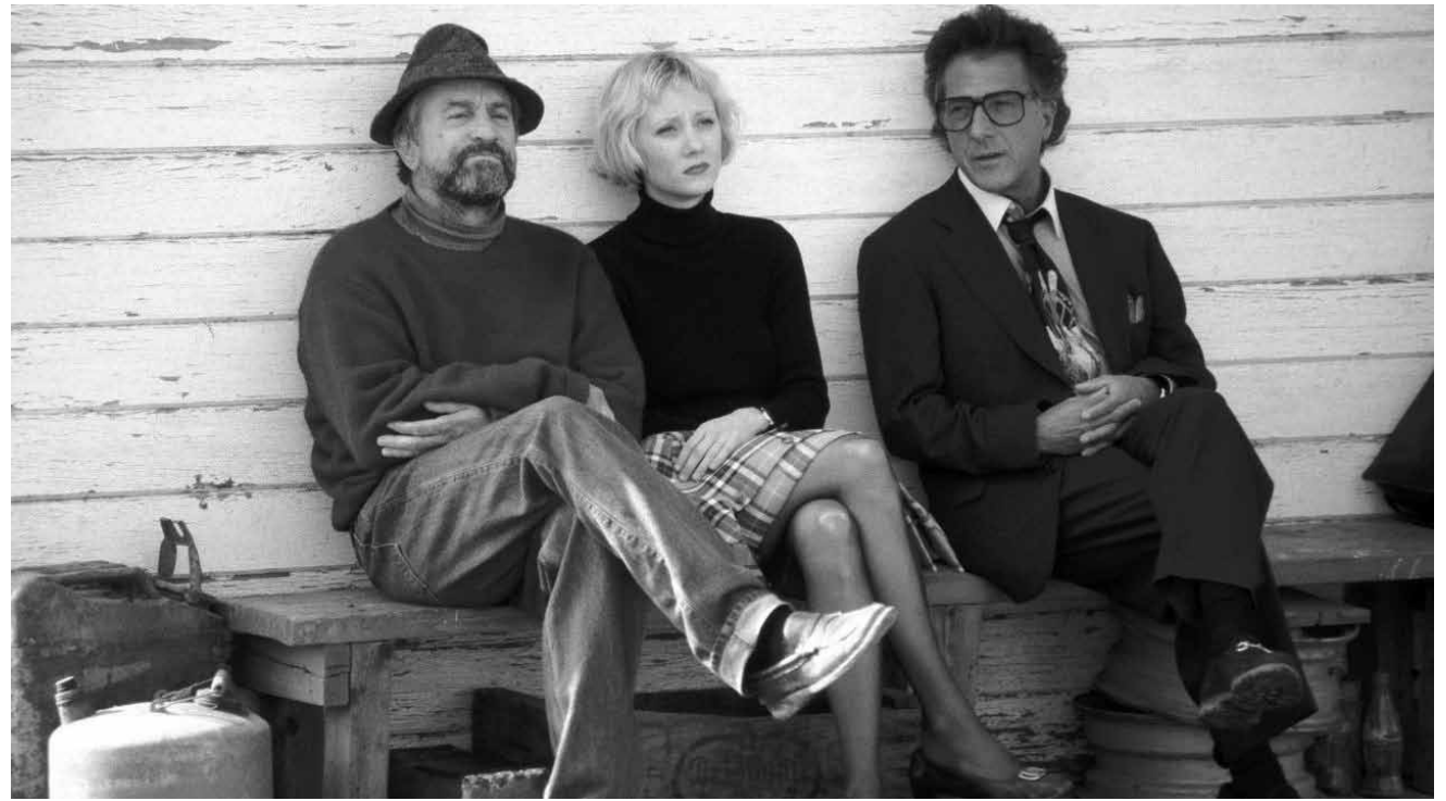
Schöne Zeiten als verrückte Geschichten über das weiße Haus noch Fiktion waren: „Wag The Dog“ - am 17. Mai in der Cinémathèque.

Im Tumult einer Zaubershow finden Richard Hannay und Annabelle Smith zueinander. Smith erklärt Hannay das sie verfolgt wird. Sie spricht auch von den geheimnisvollen „39 Stufen“ und geheimen Dokumenten, die sich eine ausländische Macht angeeignet habe. Am nächsten Tag ist die Frau tot und hält eine schottische Landkarte mit einem markierten Ort in der leblosen