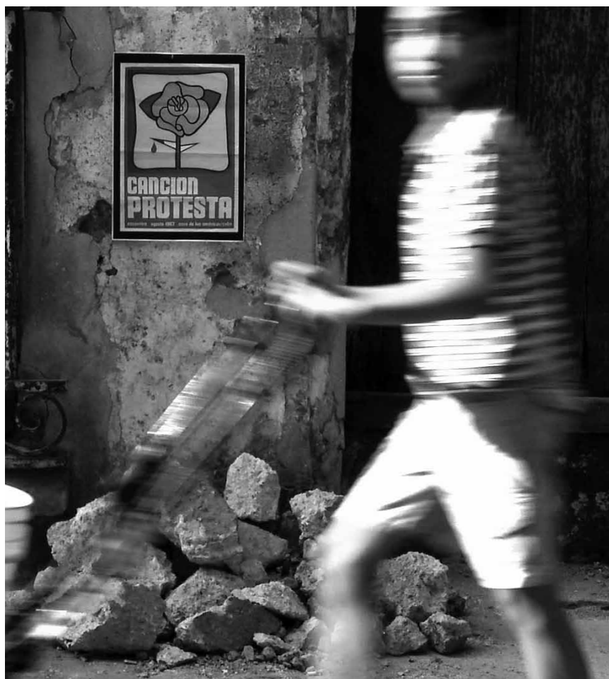
Les particularités et l'enthousiasme de la révolution cubaine, les tensions avec les États-Unis et l'URSS et le repli des années 1970 sont au centre du documentaire « Cuba, rouges années » de Renaud Schaak - ce samedi 11 mai au Kinosch.