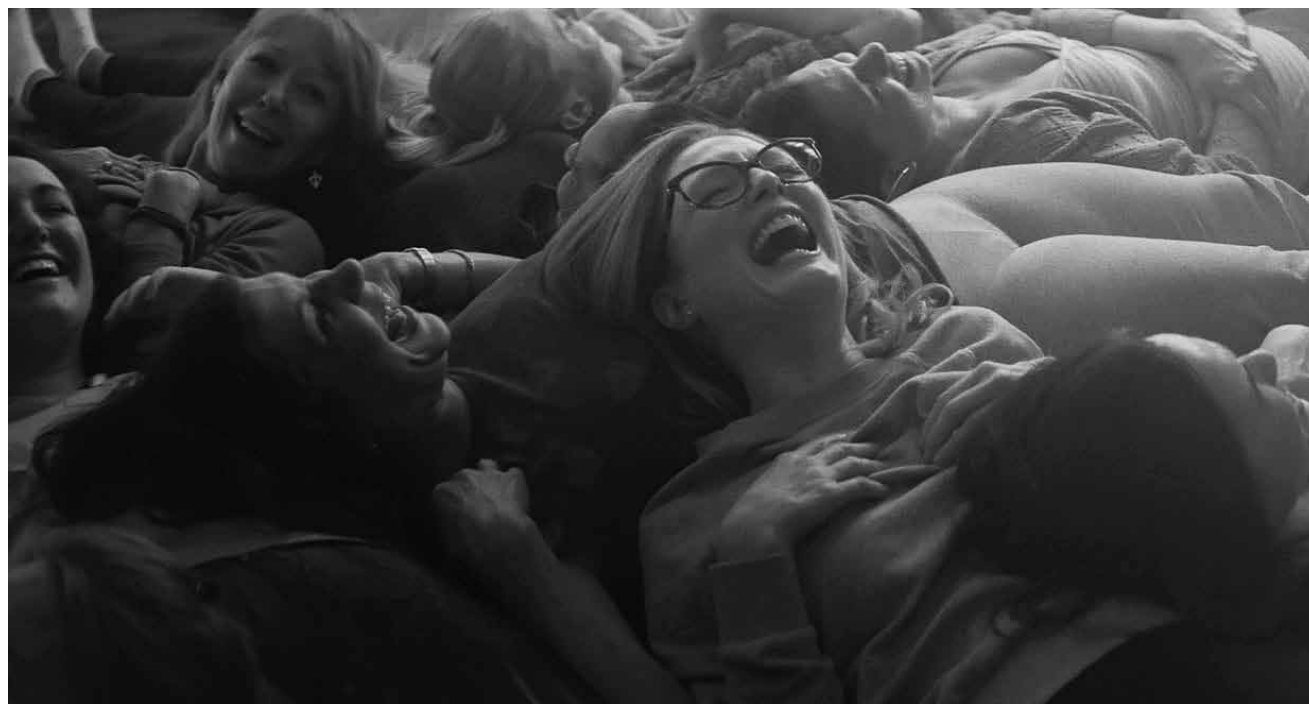
In „Gloria Bell“ versucht eine jung gebliebene Frau ihre Unabhängigkeit und ihr Familienleben unter einen Hut zu kriegen - neu im Utopia.

Forscher Overgard ist nach einem Flugzeugabsturz in der Arktis gestrandet und findet zum Glück einen Unterschlupf im Wrack der abgestürzten Maschine, wo er ausharrt und auf Hilfe hofft. Als die langersehnte Rettung in Form eines Hubschraubers ihn endlich zu erreichen scheint, kommt es zu einem folgenschweren Unfall und Overgard muss sich nun auch noch um die schwerverletzte Hubschrauber-Co-Pilotin kümmern.