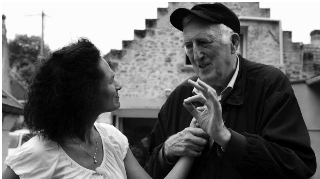
Un documentaire à la gloire de Jean Vanier, fondateur de l'Arche, une organisation qui s'occupe d'handicapé-e-s mais où de nombreux abus sexuels de religieuses ont eu lieu (qui ne seront pas dans le film) - « Jean Vanier, le sacrement de la tendresse », nouveau à l'Utopia.