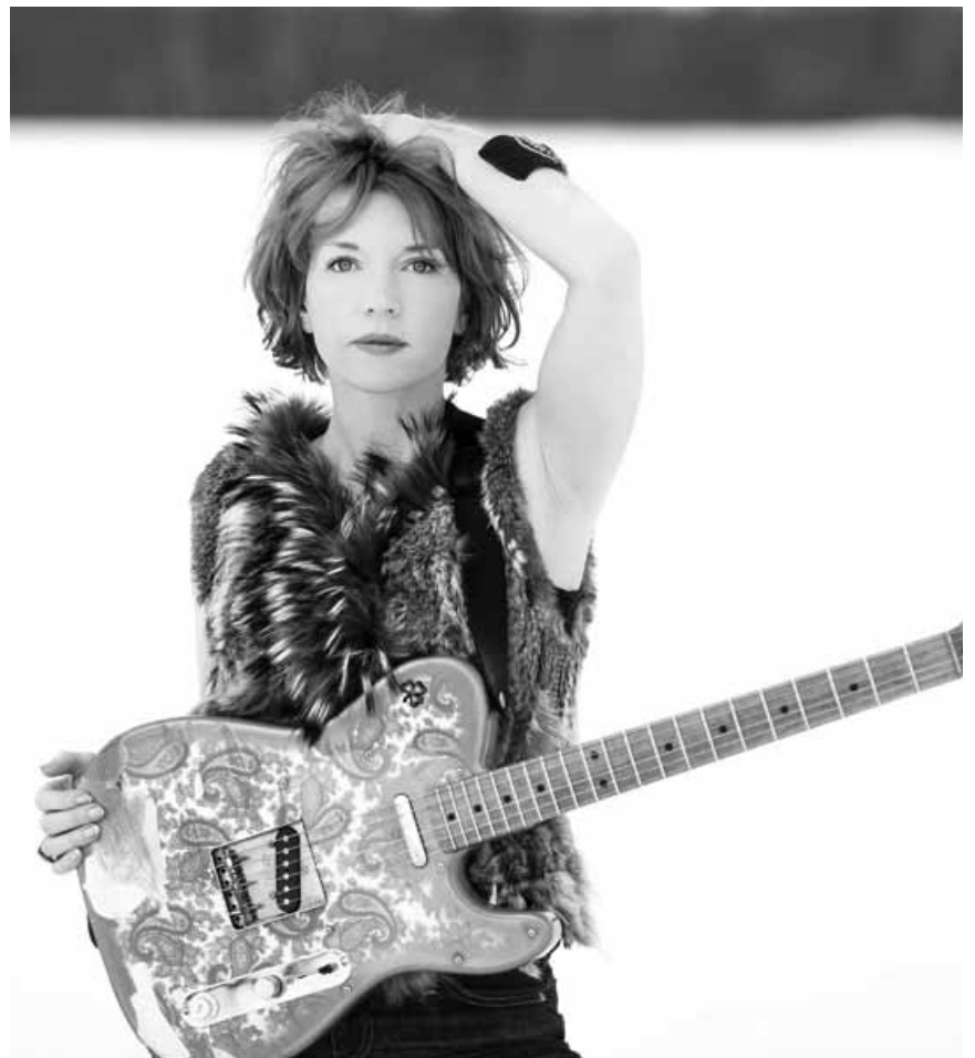
Lady's got the blues : Die kanadische Blues-Gitarristin Sue Foley tritt an diesem Freitag, dem 10. Mai im Sang a Klang auf.