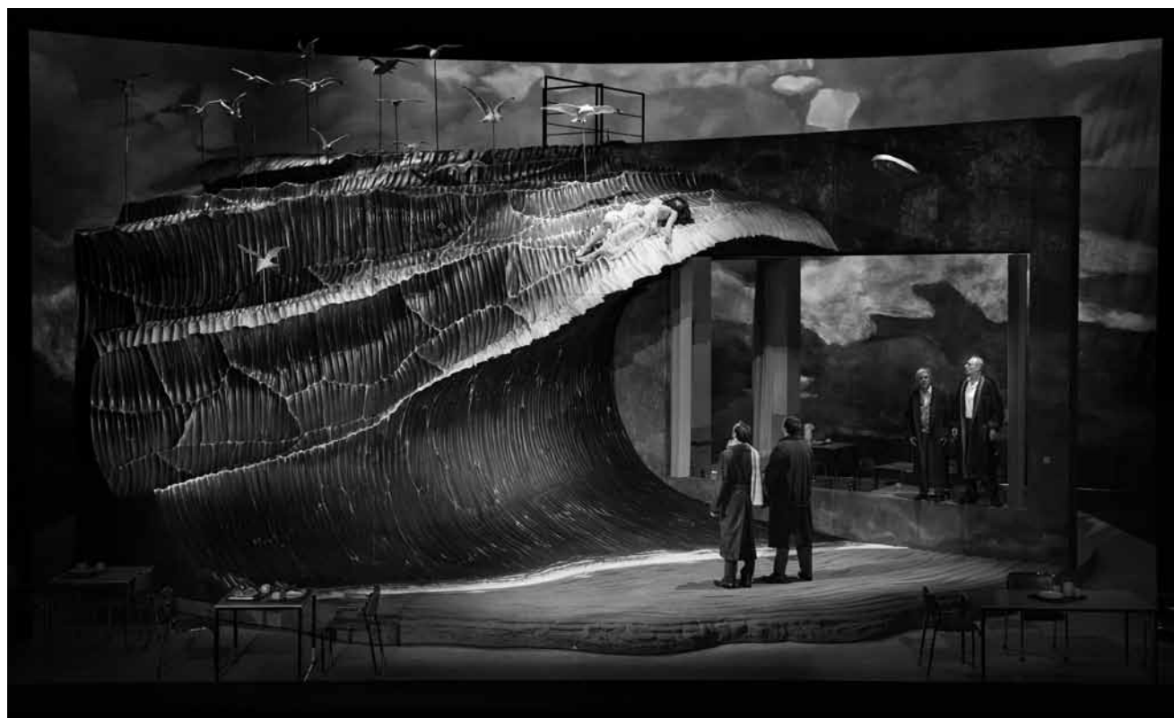
Drame entre deux hommes, une femme et une vocation de prêtresse : l'exotisme est au rendez-vous avec « Les pêcheurs de perles » de Georges Bizet, ce vendredi 10 mai au Grand Théâtre.

Play , comédie de Samuel Beckett, mise en scène de Sahika Tekand, Opéra-Théâtre Metz-Métropole,