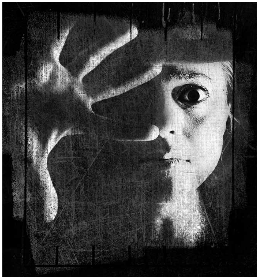
L'une des pièces les plus abstraites et ramassées de Beckett : « Play » sera à l'Opéra-Théâtre de Metz-Métropole ce samedi 11 mai.

Les carnets du sous-sol , d'après le roman de Dostoïevski, adapté pour la scène par Benoît Verhaert, maison de la culture, Arlon (B) , 20h30. Tél. 0032 63 24 58 50. maison-culture-arlon.be COMPLET !