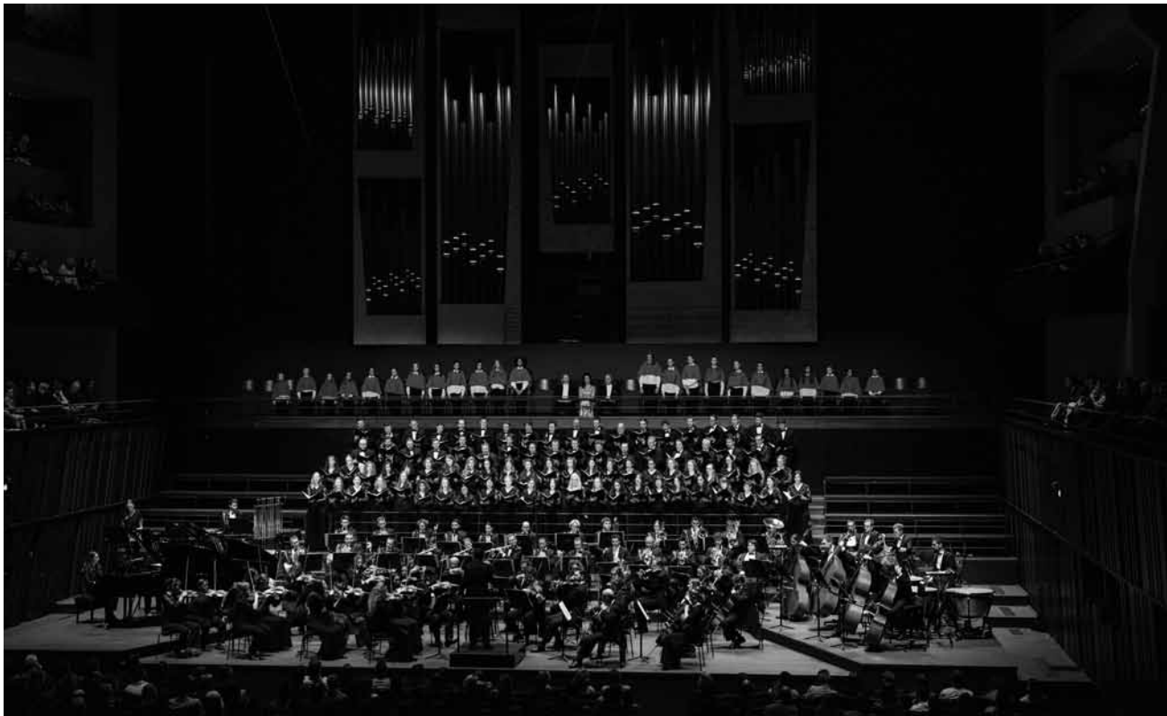
Le Chœur de chambre de Luxembourg, son académie pour jeunes voix et l'Orchestre symphonique de la Grande Région vous en mettront plein la vue et l'ouïe le 18 mai à la Philharmonie - avec des œuvres de Tchaïkovski, Bruckner et Dvorák.