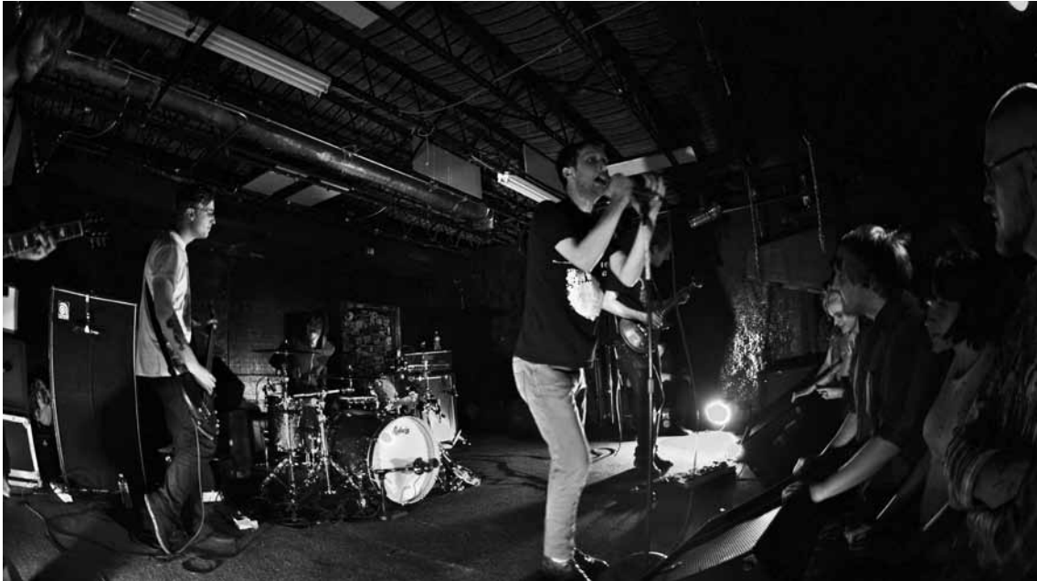
Pas grand monde ne peut lui disputer sa place au panthéon du post-hardcore : La dispute.