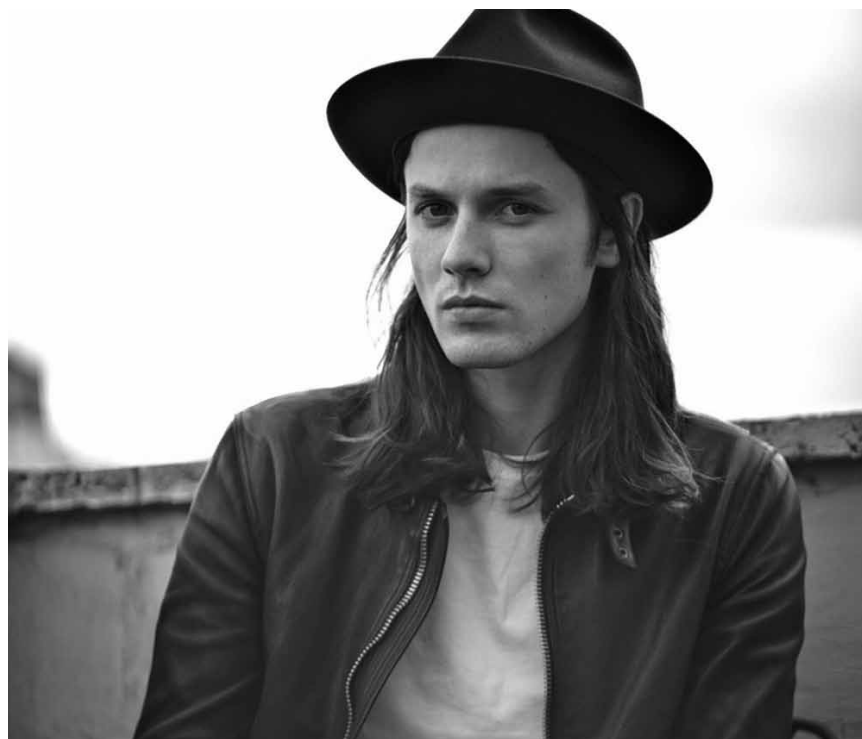
Große Gefühle erwarten das Publikum am 24. Juni in der Rockhal mit dem US-Star James Bay.

Der Kleine Prinz, Kindertanztheater (> 4 Jahre), Porta Nigra, Trier (D), 20h. www.tufa-trier.de