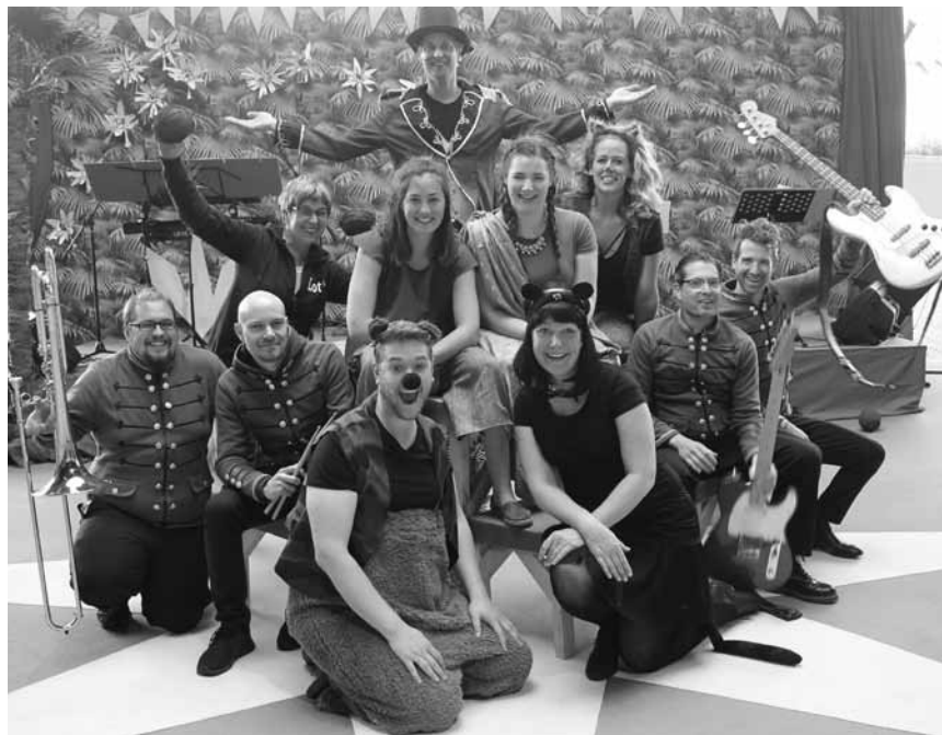
Für Kinder und solche die es wieder werden wollen: „Das Dschungelbuch“ in einer Inszenierung von Florian Burg – an diesem Samstag, dem 22. und diesem Sonntag, dem 23. Juni im Lottoforum in Trier.

Concerts electro , avec entre autres Baguette Crew, Bon entendeur et