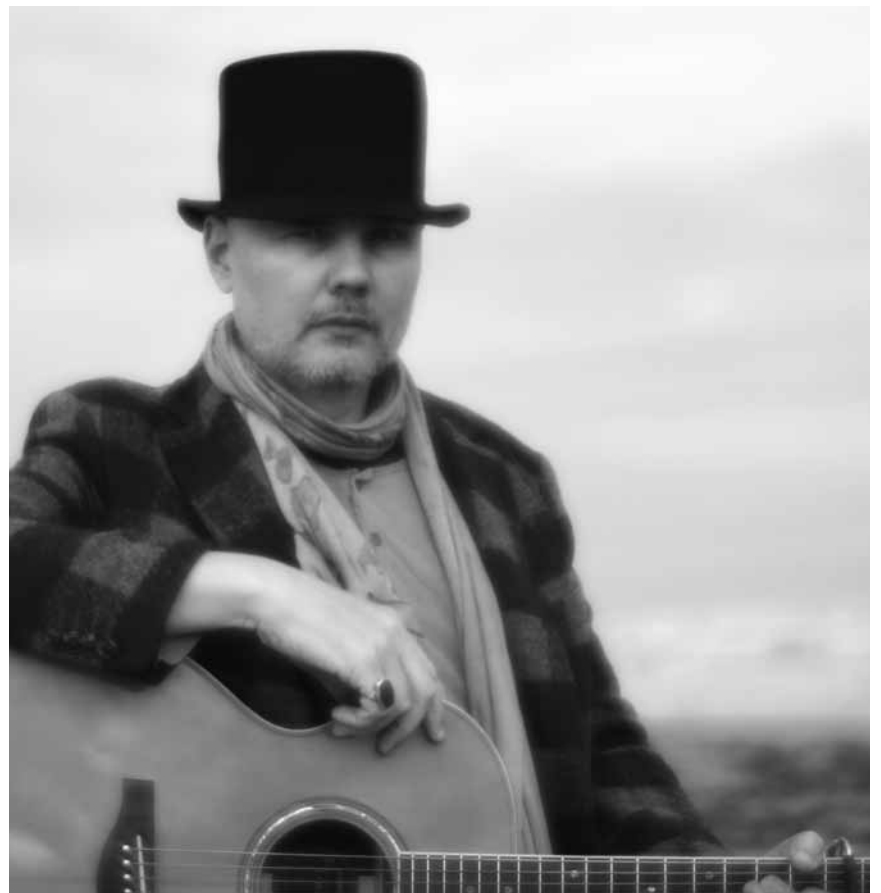
Schlägt keine Kürbisse mehr: Der ehemalige Smashing Pumpkins Frontmann Billy Corgan kommt an diesem Freitag, dem 21. Juni ins Atelier.