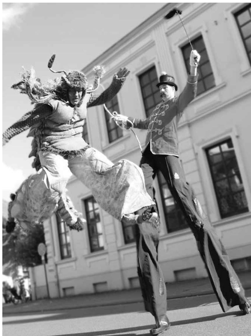
Wenn der Zirkus einfach die ganze Stadt übernimmt: „Das Zirkusfest“ findet am 30. Juni in Neuerburg statt.